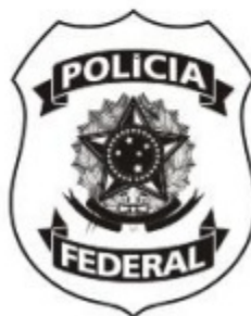
Versão 01 (uma cor - traço) Utilizada quando a reprodução de meios-tons não são possíveis ou comprometem a qualidade.