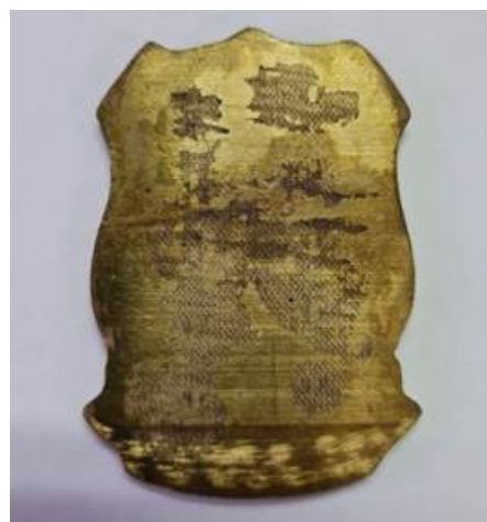
FIGURA 7 - VERSO DO DISTINTIVO METÁLICO

Emblema fora da especificação do item 9: