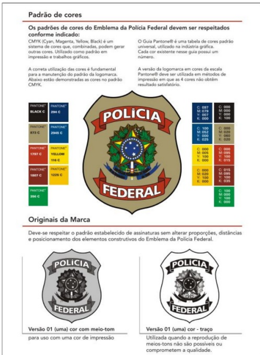
FIGURA 3 - PADRÃO DE CORES DO EMBLEMA DA POLÍCIA FEDERAL

O emblema apresentado na amostra conforme imagem abaixo não segue a totalidade das especificações: