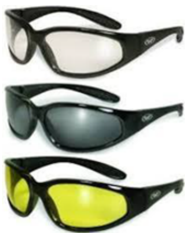
Imagem da empresa

À semelhança dos demais itens, não foi possível analisar com segurança se os itens correspondem ao objeto, tendo em vista que possui apenas uma imagem e a marca. Pela imagem, inclusive as cores são diferentes das requisitadas (amarelo, laranja e vermelha).