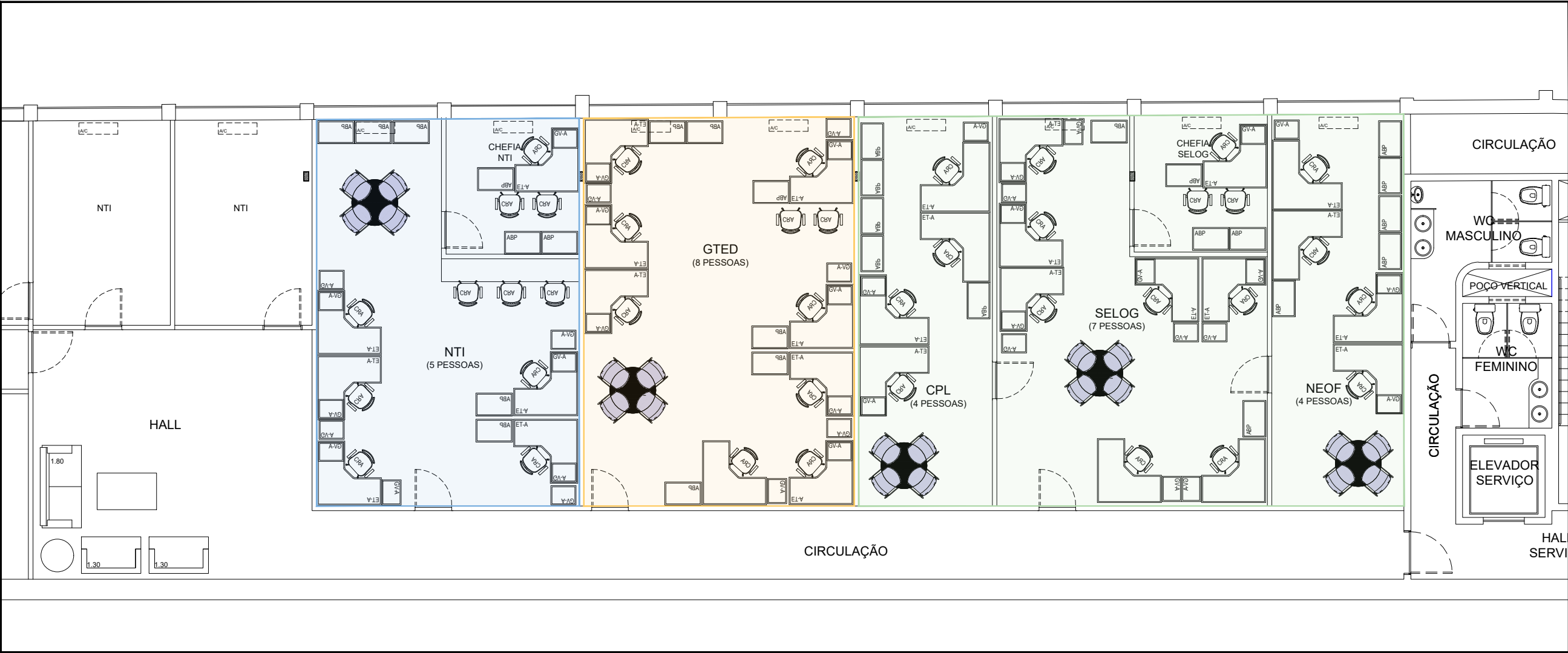
MARGARIDÃO - 1º PAVIMENTO - LAYOUT ESCALA 1/100