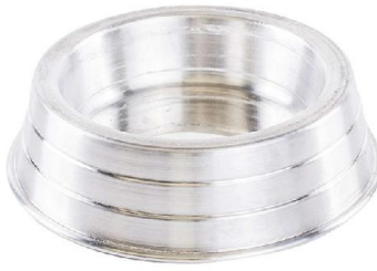
Item 6: Comedouro de metal (alumínio) tamanho M com canaleta para adição de água (anti-formiga) (imagem meramente ilustrativa).