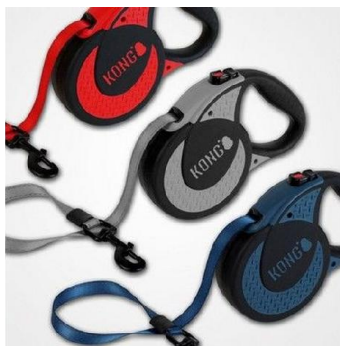
Item 9: Guia retrátil longa em fita 15 mts resistente para cão de porte grande e adulto (imagem meramente ilustrativa).