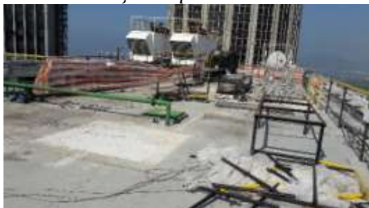
Circulação de pedestre - antes