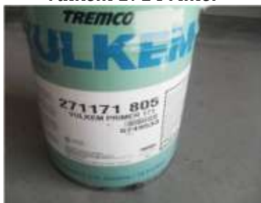
Vulkem 171 Primer