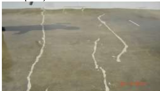
Aplicação do Vulkem 171 Primer