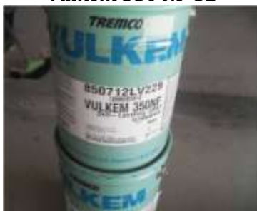
Vulkem 350 NF-SL

Alongamento: 90 a 92% Aderência: 3,0/3,2 Mpa Dureza Shore A: 50/60 PU Aromático