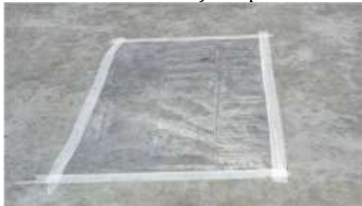
Teste de umidade filme plástico