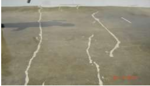
Aplicação do Vulkem 171 Primer