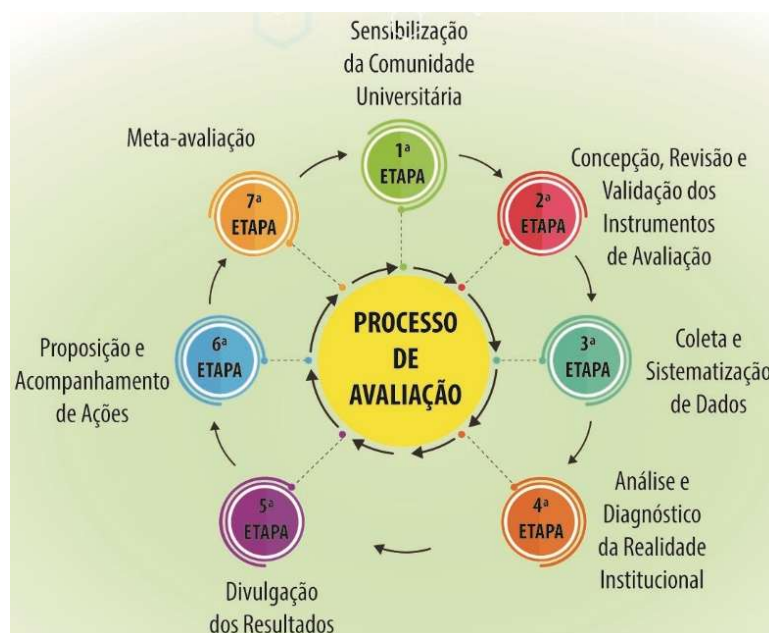
Figura 4 - Ciclo de processo de avaliação da CPA da DIREN-ANP

Esquemáticamente, o ciclo do processo de avaliação da CPA funciona conforme segue na Figura 4: