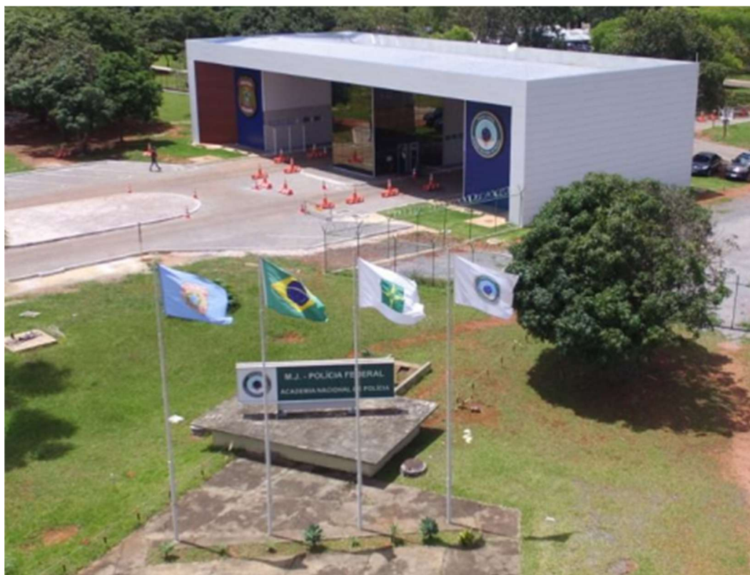
Figura 1 - Imagem da entrada da Diretoria de Ensino da Academia Nacional de Polícia

territorial e mais de 50.000 m 2 de área construída, reunindo infraestrutura acadêmica, administrativa e operacional destinada às atividades de ensino, pesquisa, extensão e apoio institucional.