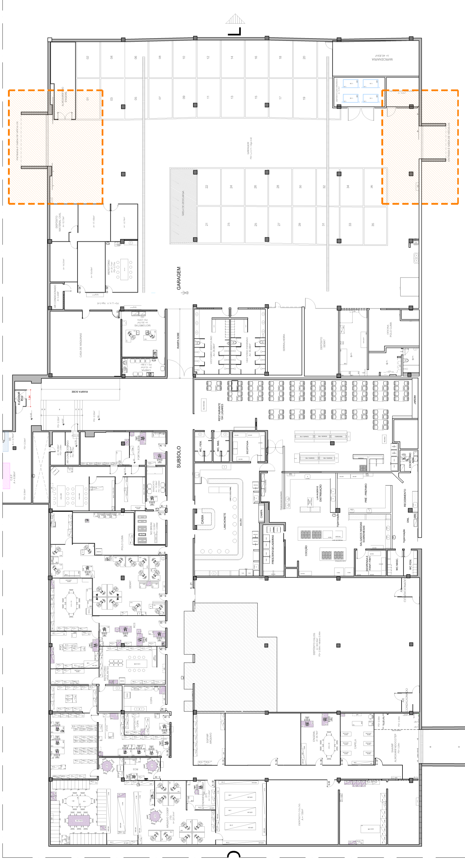
LOCALIZAÇÃO NO PAVIMENTO (SUBSOLO)