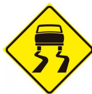
Placa A-28 Pista Escorregadia