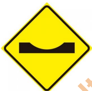
Placa A-19 Depressão