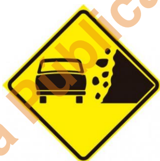
Placa A-27 Área com Desmoronamento