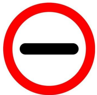
Placa R-21 Alfândega