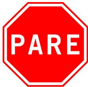
Placa R-1 Parada Obrigatória