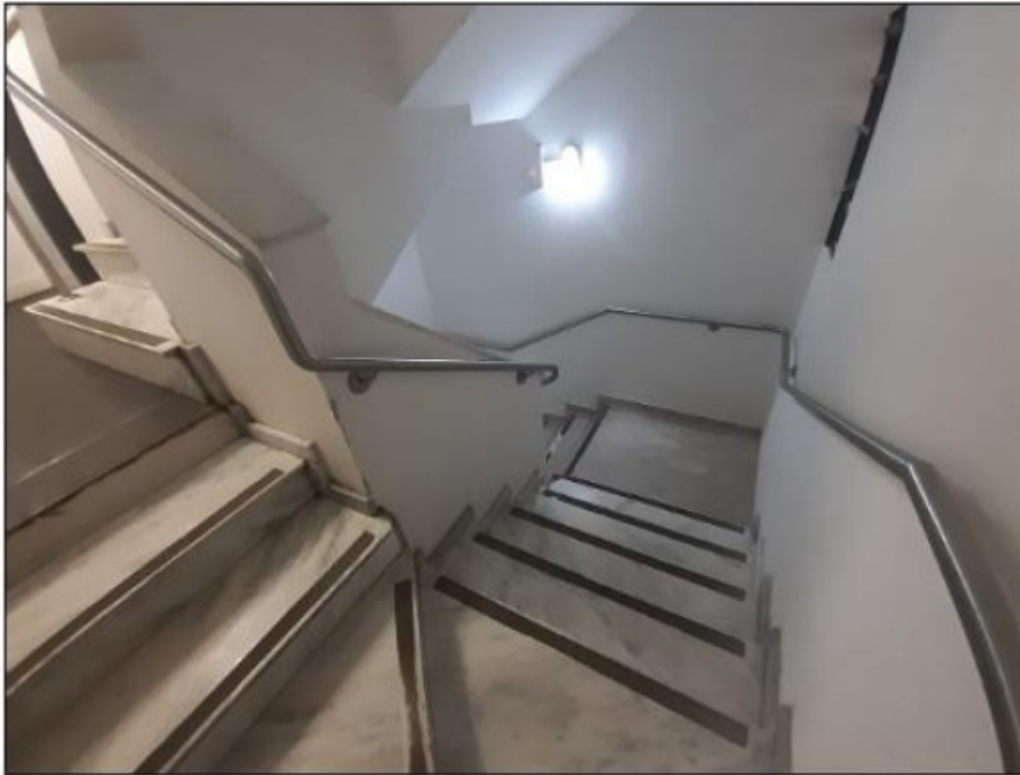
Escada em espiral quadrada - 1,10m de largura

cujas dimensões da porta de entrada são 70cm de largura x 200cm de altura, com dimensões internas de 94cm de largura x 114cm de profundidade x 220cm de altura, com capacidade máxima para 420kg. Se utilizado o elevador, a CONTRATADA deve estar ciente que existem dois degraus de escada após a saída do elevador no subsolo, não havendo projeto de criação de rampa. O outro possível acesso ao subsolo se dá pelas escadas, que tem 1,10 m de largura em espiral quadrada. Dessa forma, é necessário que a empresa conte com material portátil, cujas dimensões sejam tais que possam ser alocados no subsolo da FCP via elevador ou escada e, ainda, com equipe de carregadores e/ou montadores para alocar os equipamentos e os acervos.