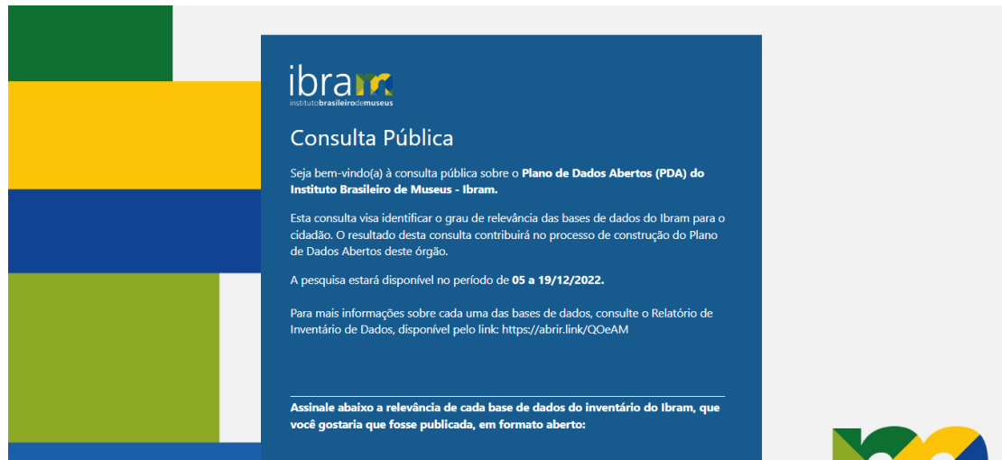
Figura 1: Cabeçalho do formulário de consulta pública

As participações se deram por meio de formulário eletrônico em que os cidadãos foram convidados a se manifestarem sobre cada uma das 63 bases de dados constantes no Inventário do Ibram.