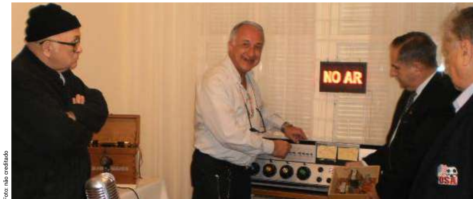
13ª SNM (2015) Museu do Rádio (Porto Alegre/RS) Público visitando a exposição.