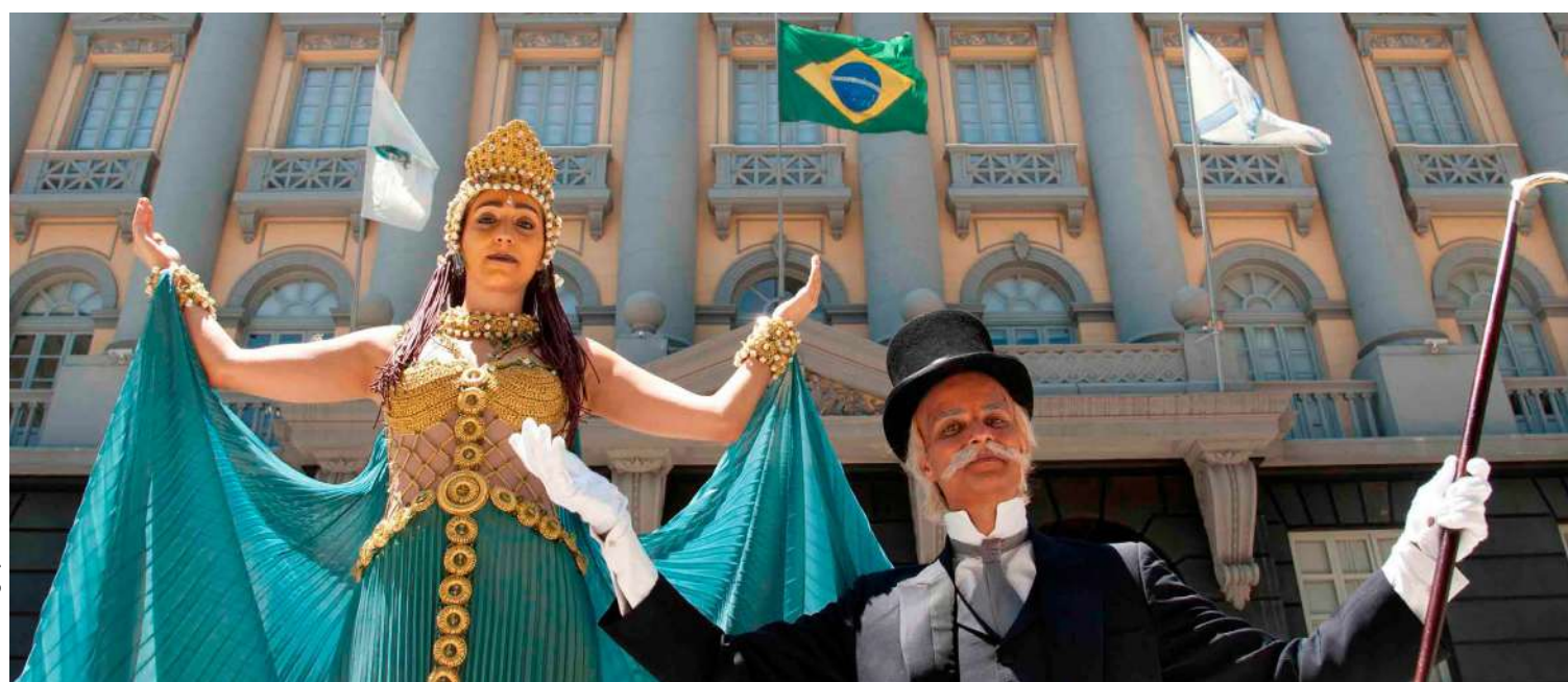
14ª SNM (2016) Centro Cultural do Poder Judiciário do RJ (Rio de Janeiro/RJ) Visita Mediada com a Deusa Têmis.

AV DOM HELDER CAMARA, 4242 - ANEXO A CATEDRAL DA IURD - DEL CASTILHO ecristina@centroculturaljerusalem.com.br Tel:(21) 2582-0140