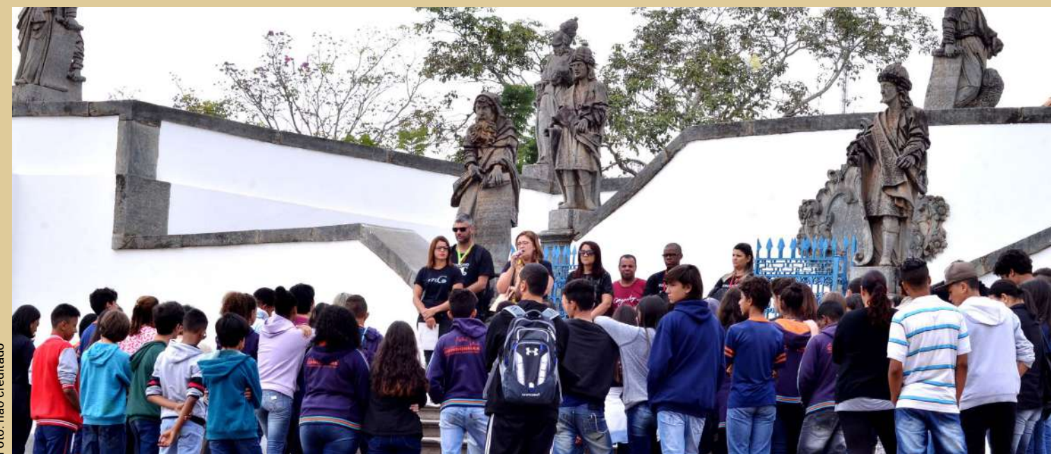
Ver programação na próxima página.

ALAMEDA CIDADE DE MATOSINHOS DE PORTUGAL, 77 - BASÍLICA educativomuseudecongonhas@gmail.com Tel:(31) 3732-2526 (31) 3731-6747