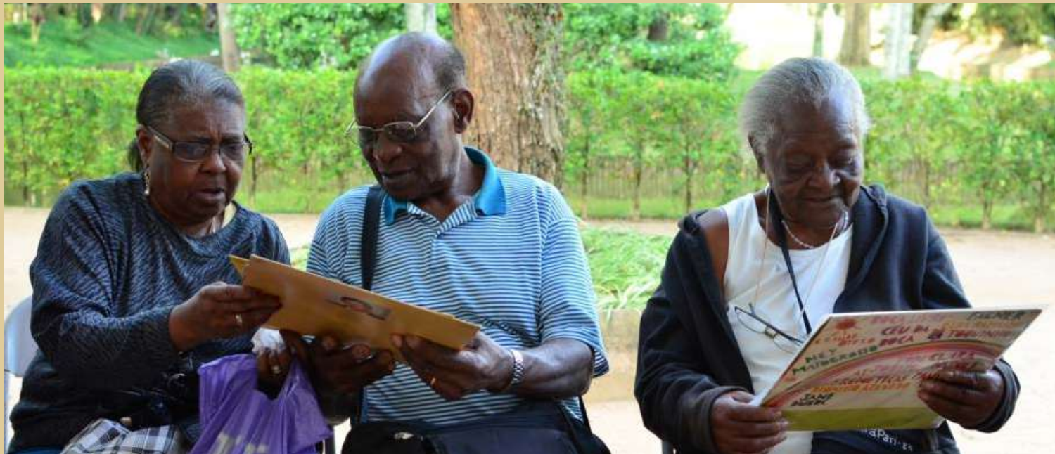
Ver programação na página anterior.