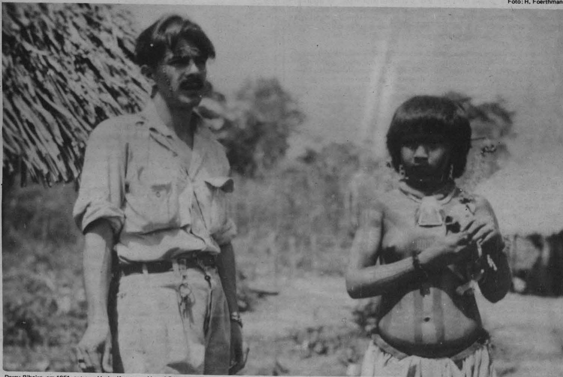
Darcy Ribeiro, em 1951, entre os Urubu-Kaapor no Maranhão.