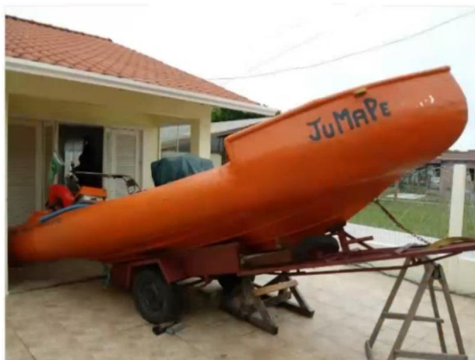
Figura 3. Exemplo de embarcação artesanal de pequeno porte, apresentado na proposta de ordenamento da pesca de botes no litoral norte do estado do RS.

O Sr. Alexandre Fonseca (EMA/MB) apresentou diversos questionamentos voltados à segurança da navegação, incluindo: limite máximo de afastamento da costa; existência de dispositivos de geolocalização para socorro; controle do tempo de permanência no mar; capacidade estrutural dos botes; possibilidade de uso de embarcações de apoio para descarga; existência de projeto-padrão para inspeção naval; situação das 60 embarcações previstas na modalidade; e equipamentos de salvatagem obrigatórios.