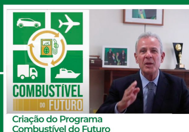
Criação do Programa Combustível do Futuro