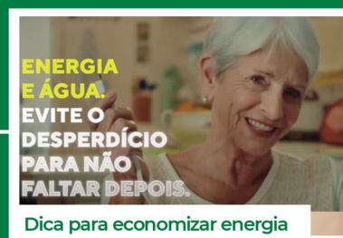
Dica para economizar energia

Acompanhe mais informações do MME em nossas redes sociais