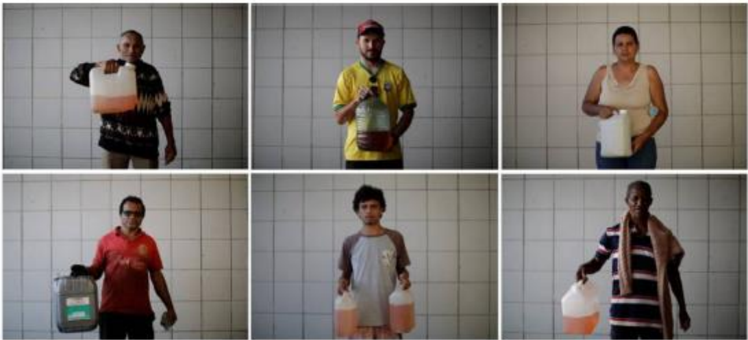
Moradores de Brasília posam com galões após finalmente conseguirem gasolina.

Estradas voltam a ter circulação, mas Governo ainda contabiliza mais de 500 pontos de protestos. Filas gigantescas em SP, PE e Rio para tentar abastecer. Transtornos ainda marcarão feriado