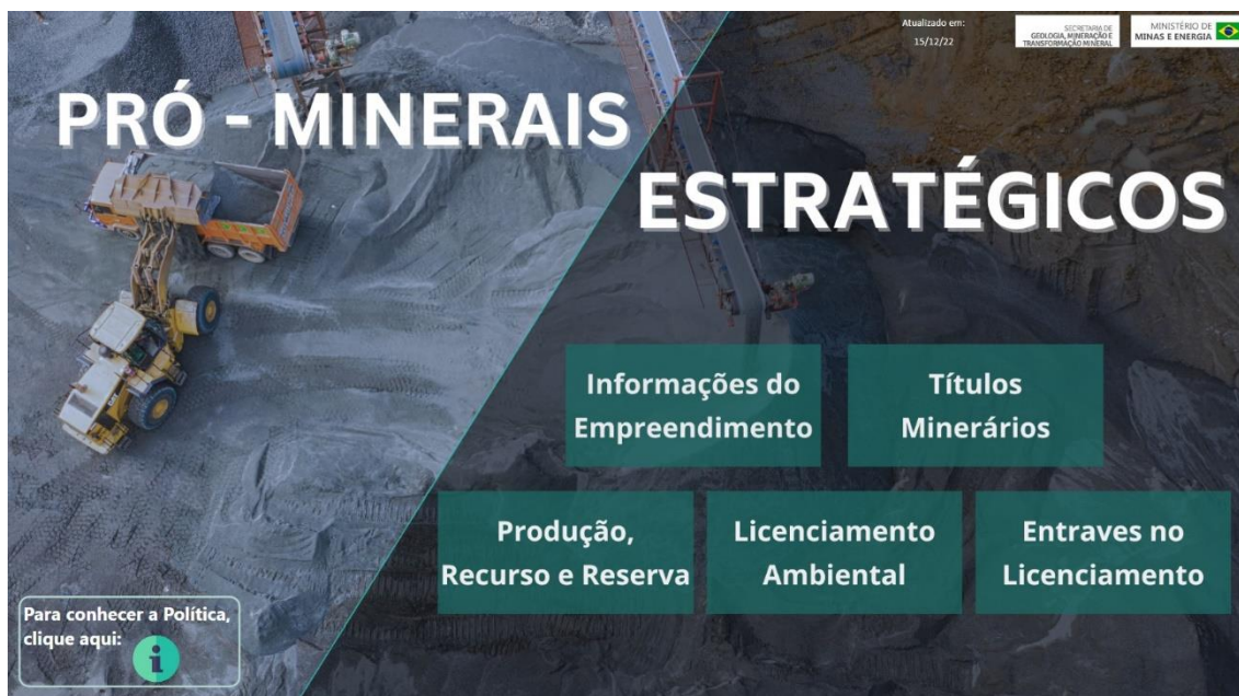
Figura 2: Capa da plataforma interativa da Política Pró-Minerais Estratégicos.

A plataforma interativa da Política Pró-Minerais Estratégicos foi elaborada pela ferramenta de Power BI da Microsoft. A ferramenta permite o usuário a acessar informações personalizadas acerca dos projetos habilitados na política de acordo com seu interesse. A plataforma traz as informações mais relevantes de cada projeto como conhecimento geral dos empreendimentos, títulos minerários, quantidades de produção, reservas e recursos, informações sobre o licenciamento ambiental e entraves no licenciamento.