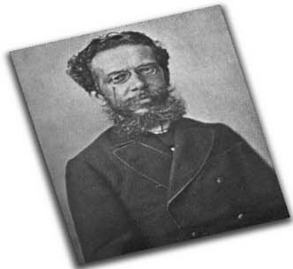
O autor de "Dom Casmurro", "Quincas Borba", entre outras obras, é patrono in memoriam da Imprensa Nacional desde janeiro de 1997.

Machado de Assis, no início de sua carreira literária, trabalhou, de 1856 a 1858, como aprendiz de tipógrafo, usando o prelo que hoje está em exposição no Museu da Imprensa. Em 1867 regressa ao órgão oficial para trabalhar como ajudante do diretor de publicação do Diário Oficial , cargo que ocupou até 6 de janeiro de 1874.