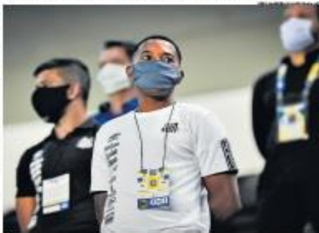
Robinho foi o jogador que mais sofreu com o escândalo de estupro. Ele foi despedido do Santos.

Após divulgação de vídeo em que o jogador é visto em uma situação íntima com uma mulher, o clube decidiu desistir dele.