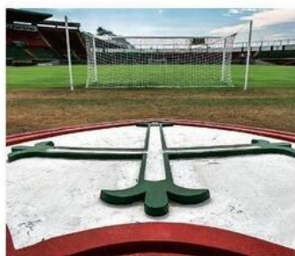
Gramado do Canindé, em São Paulo

Integrantes das Forças Armadas trabalham na limpeza das áreas de visitação do monumento, que voltará a ser aberto ao público amanhã, no Rio Saúde B1