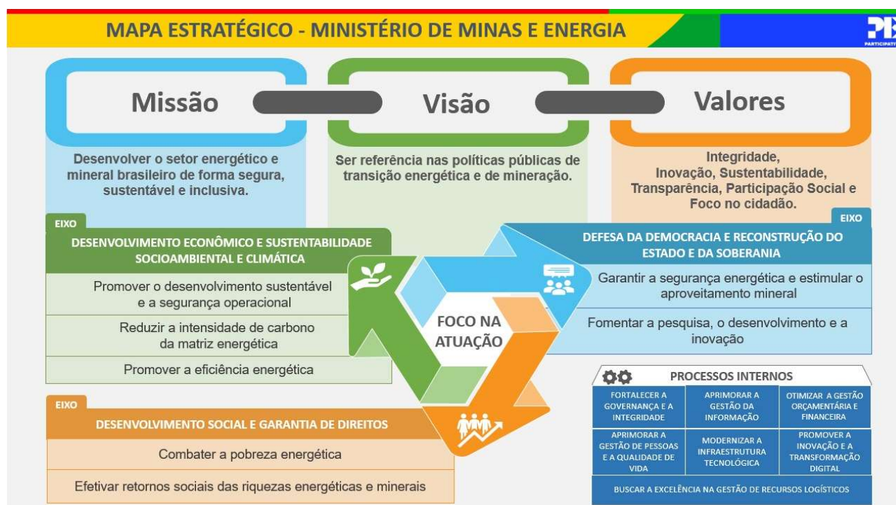
Figura 2 – Mapa Estratégico do MME

A seguir é apresentado o atual Mapa Estratégico do Ministério de Minas e Energia, contendo as principais diretrizes.