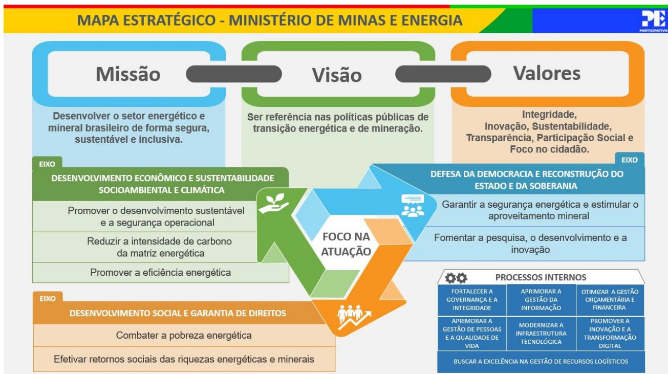
Figura 2 – Mapa Estratégico do MME

A seguir é apresentado o atual Mapa Estratégico do Ministério de Minas e Energia, contendo as principais diretrizes.