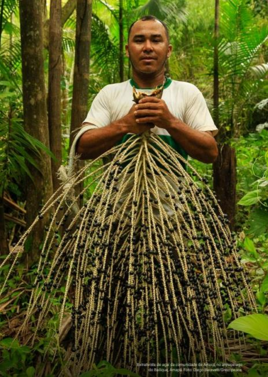
Extrativista de açai da comunidade do Arraial, no arquipélago do Bailique, Amapá.