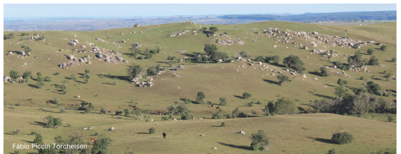
Fábio Piccin Torchelsen