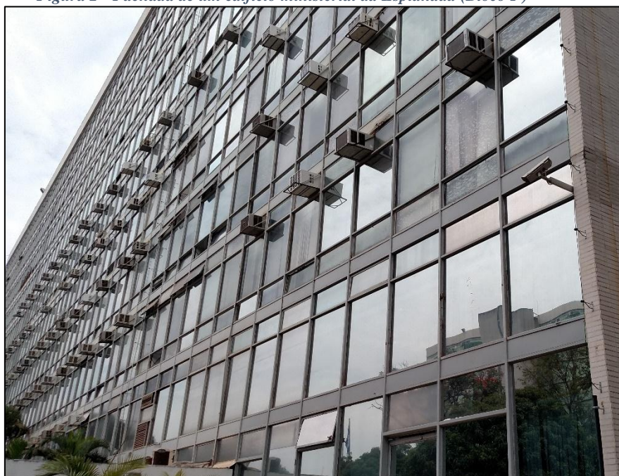
Figura 2 - Fachada de um edifício ministerial da Esplanada (Bloco F)