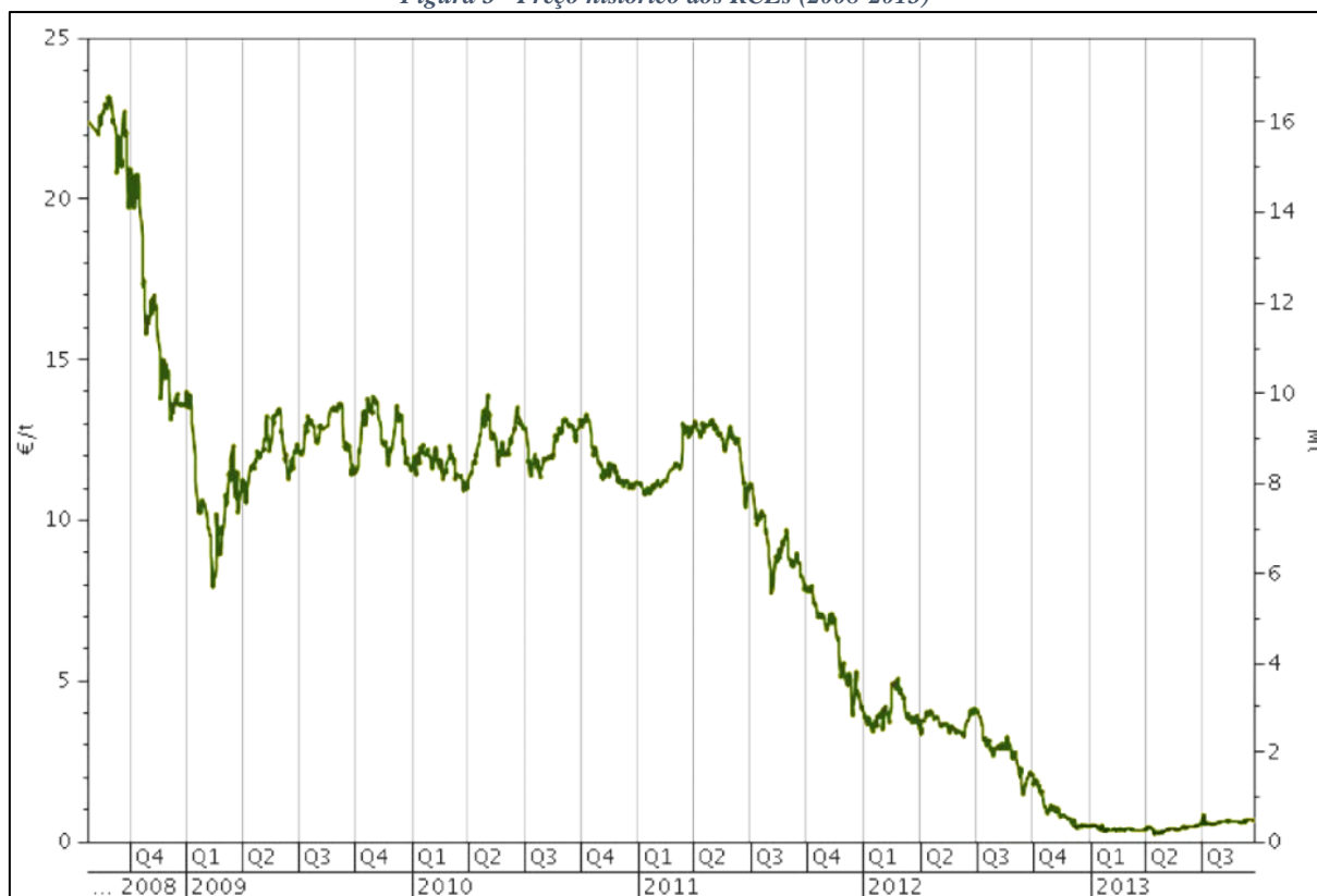
Figura 3 - Preço histórico dos RCEs (2008-2013)

Fonte: http://carbonfinanceforcookstoves.org/carbon-finance/prices-for-improved-cookstove-projects/