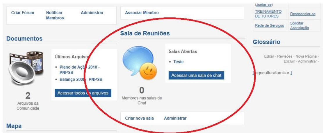
Figura 2 - Sala de reuniões virtuais no portal