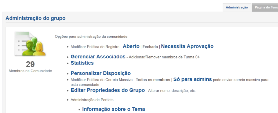
Figura 6 - ambiente virtual - página de administração das turmas

Portal da Cidadania » Assuntos » Sociobiodiversidade » Políticas Públicas de Apoio a Comercialização de Produtos da Sociobiodiversidade » Turma 04 » Painel de Controle