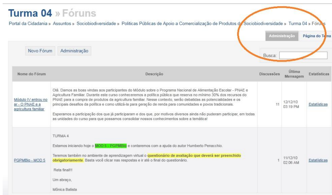
Figura 10 - ambiente virtual - fóruns

Os módulos de estudo foram divididos em 5 a 7 unidades, e foram disponibilizados dentro do ambiente virtual com fácil acesso, podendo ser diferenciado por cores, a cada conclusão de módulo o aluno recebe automaticamente autorização para acessar os próximos conteúdos.