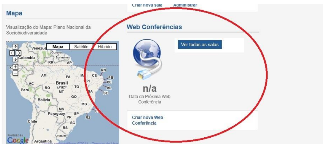
Figura 1 - Web conferências no portal

Para fortalecer o acesso e a qualificação no uso de instrumentos de gestão do conhecimento, visando à capacitação de agricultores familiares, extrativistas e agentes de ater, e promover uma adequação na dinâmica da Comunidades é para que ocorram reuniões virtuais o portal possui a ferramenta de Sala de Reuniões - Chat's - de forma sistemática, visando manter os participantes das organizações com foco nas atividades a serem desenvolvidas nos respectivos temas, mantendo-os coordenados, articulados e conectados permanentemente.