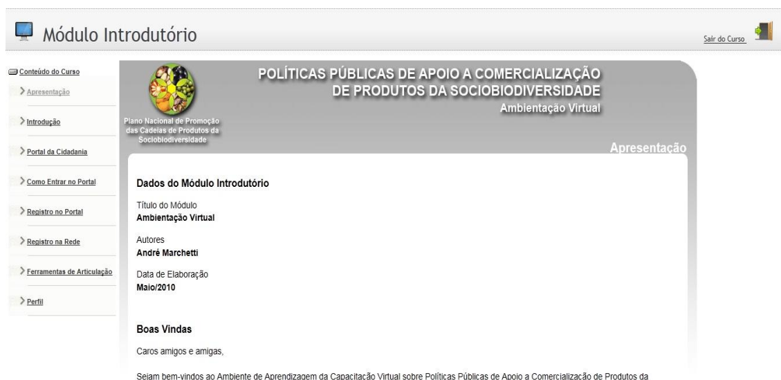
Figura 9- ambiente virtual - módulo de aprendizagem

O ambiente de aprendizagem virtual, possui um sistema de envio de mensagem aos alunos, podendo ser direcionada individualmente ou ser enviada em massa. Os participante recebem em seu email cadastrado no portal a notificação da mensagem e devem acessar o portal para ler o conteúdo da mensagem.