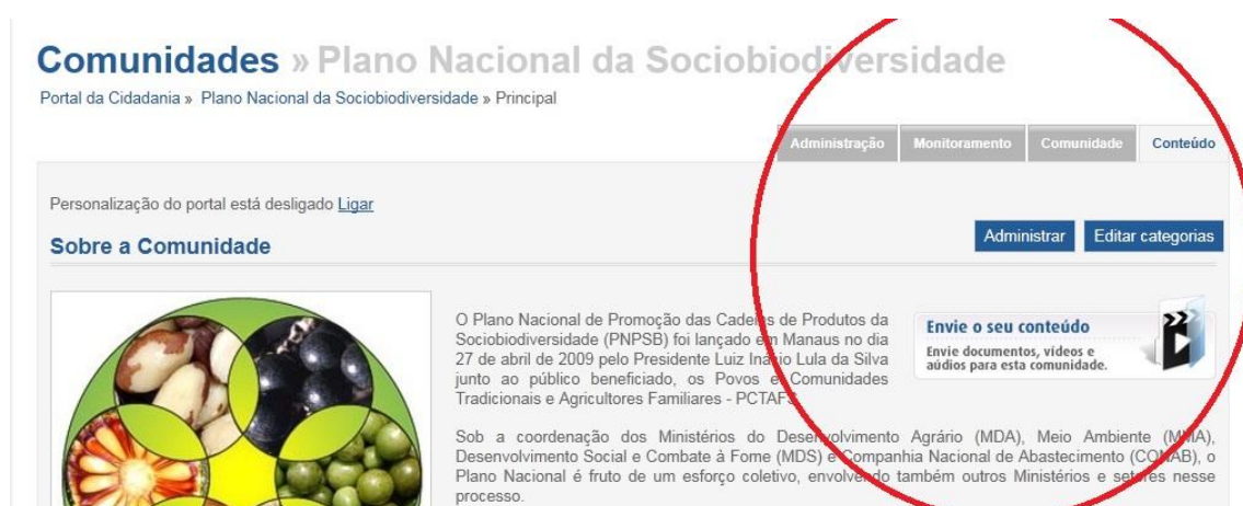
Figura 4 - Link para envio de conteúdos para o portal

Por meio da página de abertura do Portal da Comunidade Plano Nacional da Sociobiodiversidade, mediante seu cadastro e possível o acesso e envio de documentos que estarão disponíveis aos usuários da internet.