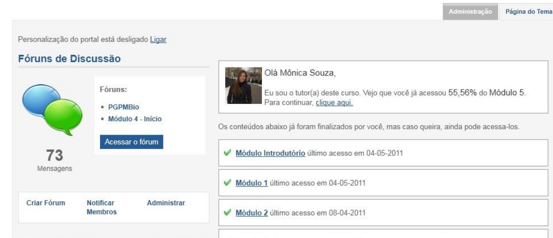
Figura 7- ambiente virtual – sala de aula da capacitação virtual

Portal da Cidadania » Assuntos » Sociobiodiversidade » Políticas Públicas de Apoio a Comercialização de Produtos da Sociobiodiversidade » Turma 01 » Principal