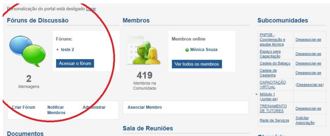
Figura 5 - Fóruns de discussão no portal

A Comunidade dispõe também de um ambiente de discussão denominado fóruns onde podem ser lançadas perguntas ou temas para debates com contribuição dos associados e moderado por técnicos ou especialistas.