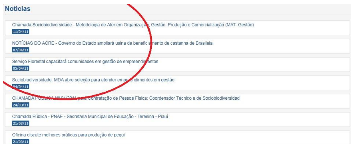
Figura 3 - Página de notícias no portal

Desta forma, no Portal da Comunidade Plano Nacional da Sociobiodiversidade apresenta uma importante ferramenta de notícias ligada a sua Rede de Associados. Esse sistema de notícias possibilita que todos os membros inseridos na Comunidade possam estar contribuindo com as notícias sobre o tema, suas organizações e suas ações como extensionistas/agentes de ater, etc.