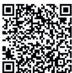
Fundamentos do Planejamento de Trilhas