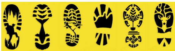
Exemplos de pegadas

Assegure-se que os direitos autorais do desenho e uso da pegada/rastro de bike usado para sinalizar a trilha estejam registrados em cartório como de livre uso.