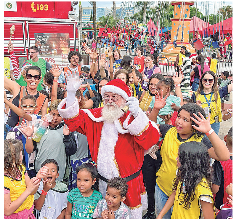
Evento é dedicação a meninos e meninas de 0 a 17 anos

Além de brincar no parque, cada participante recebeu lanches, como pipoca, sanduíches, refrigerante e água e, ao final do evento, um kit completo de presente, composto por roupa, calçado e brinquedo. Avaliado em cerca de R$ 300, o kit foi montado ao longo dos últimos dois meses, em uma