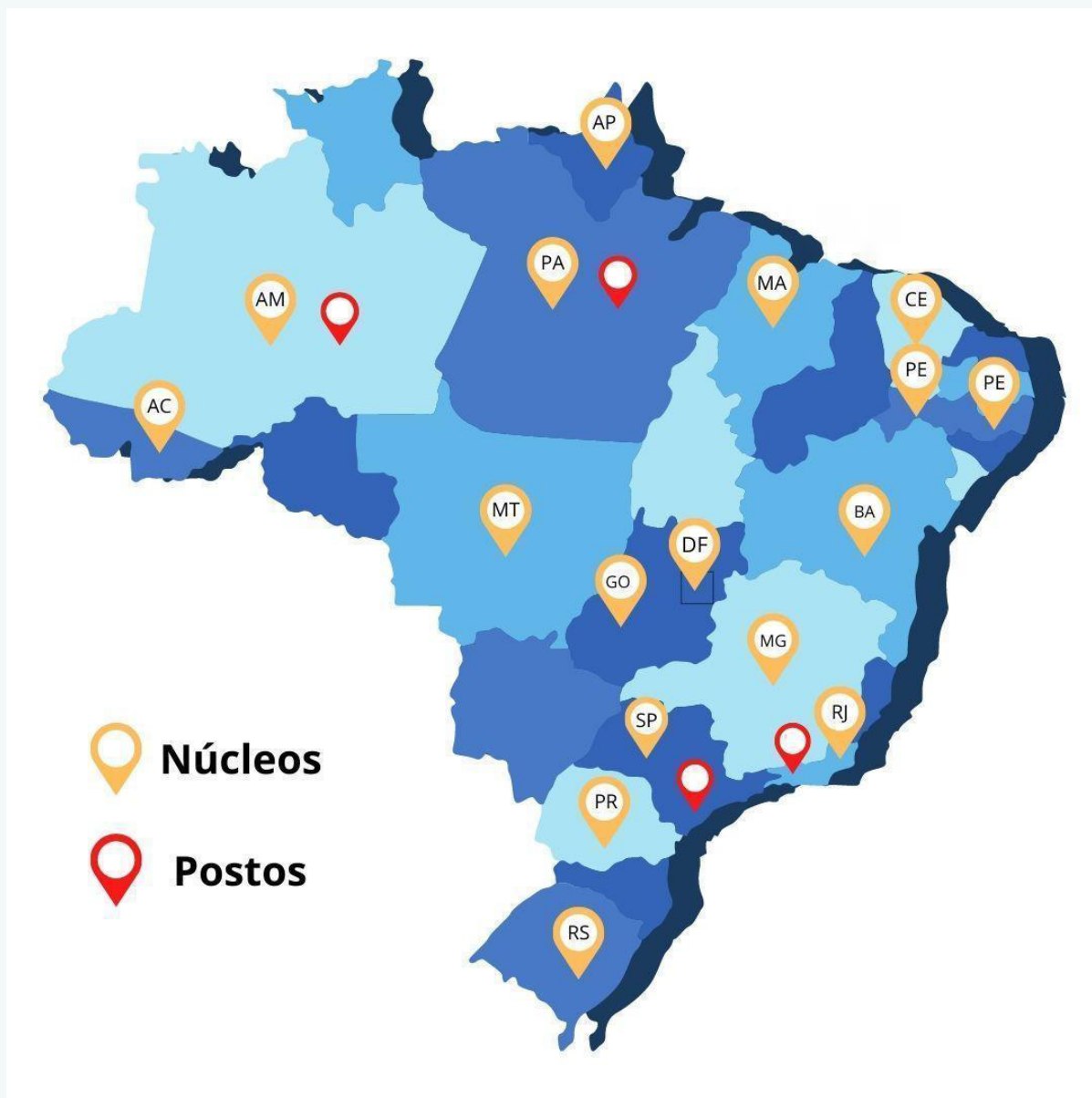
Figura 1 – Núcleos de Enfrentamento ao Tráfico de Pessoas e Postos Avançados de Atendimento Humanizado a Migrantes – Brasil

Atualmente, existem NETPs em 16 estados, indicados na figura a seguir: