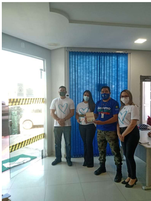
Figura 4 – Papo de Domingo 102 FM