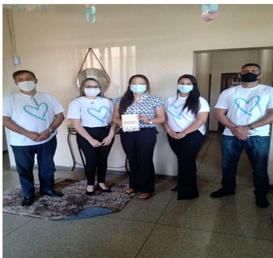
Figura 2 – Secretaria de Saúde do Estado do Amapá