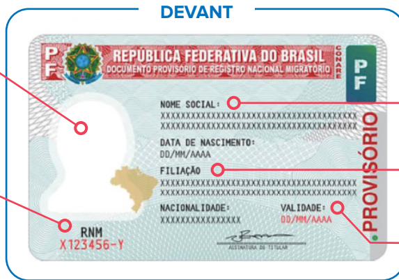
Photo / image du demandeur.

Il s'agit d'un document d'identité délivré par la Police Fédérale aux demandeurs d'asile. Pour plus d'informations, consultez le Décret n° 9 277 du 5 février 2018 ( bit.ly/3qMZit6 ).