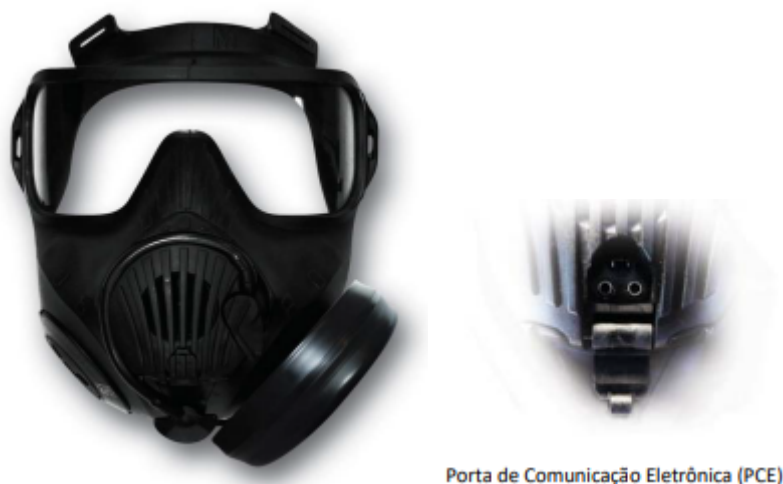
Figura 1 - Máscara Contra Gases Imagem de Referência

FILTRO COM PROTEÇÃO CONTRA LACRIMOGÊNEOS PARA MÁSCARA POLICIAIS CONTRAGASES , com capacidade de filtragem de partículas de 0,185 microm de diâmetro e maior do que 99,97%. Que ofereça no mínimo 24 horas de proteção contra a contínua exposição ao CS, CN, e OC. Deve ter um elemento de filtro de partículas excedendo os requisitos do NIOSH CBRN para proteção contra produtos químicos perigosos., o nível é incorporada, garantindo um desempenho eficaz contra poeiras, névoas, fumos. Deve ser compatível com a máscara.