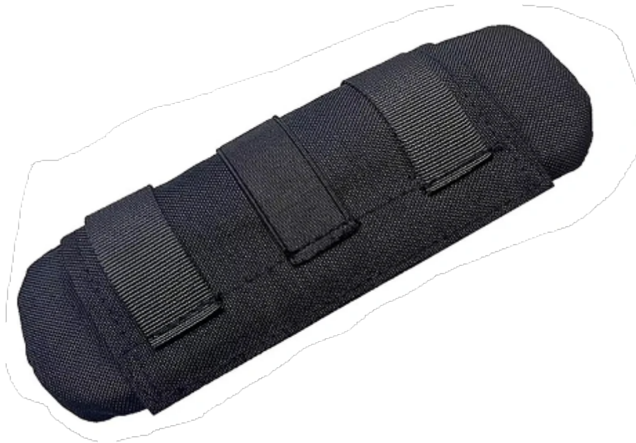
Figura 4 - almofada de proteção para ombros Imagem de Referência