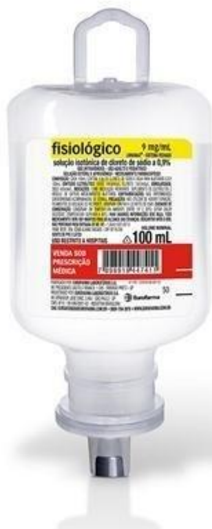
Cloreto de Sódio 0,9% injetável frasco unitário 100ml, uso Adulto e Pediátrico