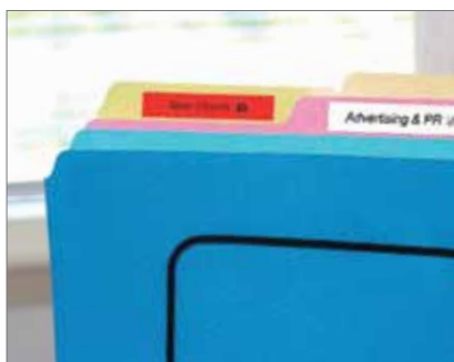
Etiquetas para uso Profissional...