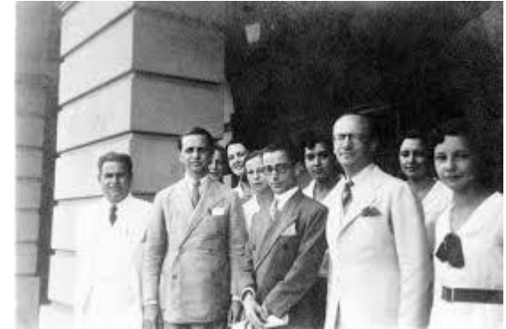
Manifesto dos Pioneiros da Educação Nova