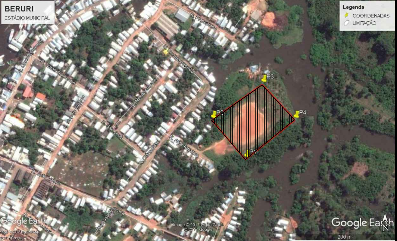
01 MAPA SATÉLITE SEM ESCALA

TERRENO NATURAL A=10.127,28m² P=382,80m²