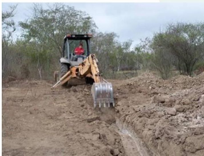
Figura 6: Escavação da vala

Quanto mais arenoso for o solo, mais larga deve ser a vala de modo a evitar o desmoronamento. Se houver água na vala, o risco é maior.