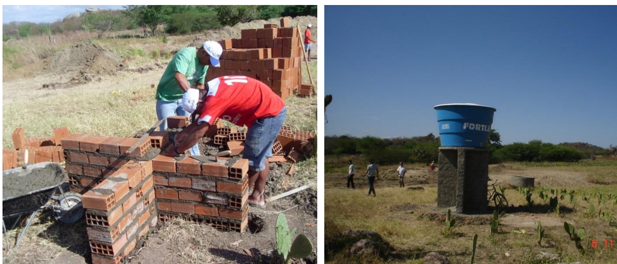
Figura 12: Instalação da caixa d'água