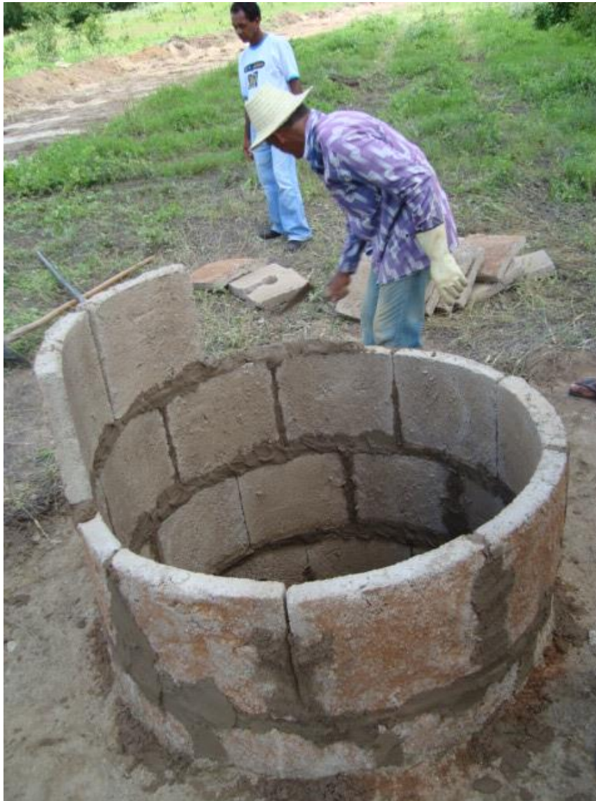
Figura 11: Construção do poço (cacimbão)

As bordas do revestimento do poço devem se elevar até a altura de 1 m acima do nível do solo.