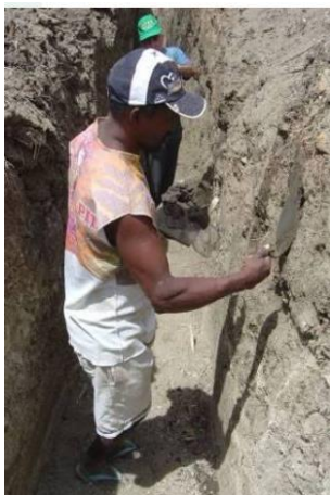
Figura 7: Acabamento da escavação e preparo para a colocação da lona

Após o término do trabalho com a retroescavadeira, as laterais e o fundo da vala devem passar por um cuidadoso acabamento com a utilização de enxada e outras ferramentas manuais adequadas, de modo a obter uma superfície regular e lisa, livre de pedras e raízes, sendo que o fundo deve ser levemente compactado.