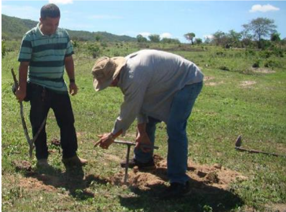
Figura 5: Locação e sondagem do solo

Se for constatado que o local é propício, deve-se fazer a limpeza do terreno.