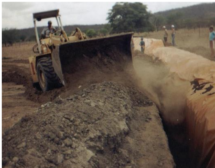
Figura 9: Aterramento

Durante o processo de aterramento, caso a lona seja perfurada, pode-se fazer o remendo com restos de lona, utilizando cola de sapateiro para vedar a parte danificada.