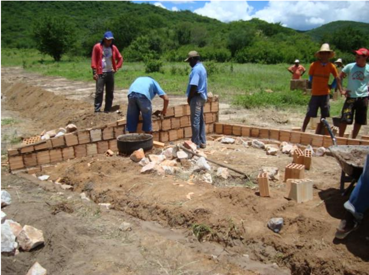
Figura 10: Construção do vertedouro (sangradouro)

O tamanho do sangradouro depende da quantidade de água que vai passar no período das chuvas mais fortes. Ele deve ser construído para suportar a maior quantidade de chuvas da região. Em cada local deve ser estudado o tamanho ideal a ser construído.