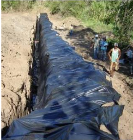
Figura 8: Colocação da lona

A lona deve ser estendida ao longo da vala e desdobrada cuidadosamente, até que atinja o fundo da vala e toda sua extremidade seja colocada no sulco e em seguida presa com cimento.