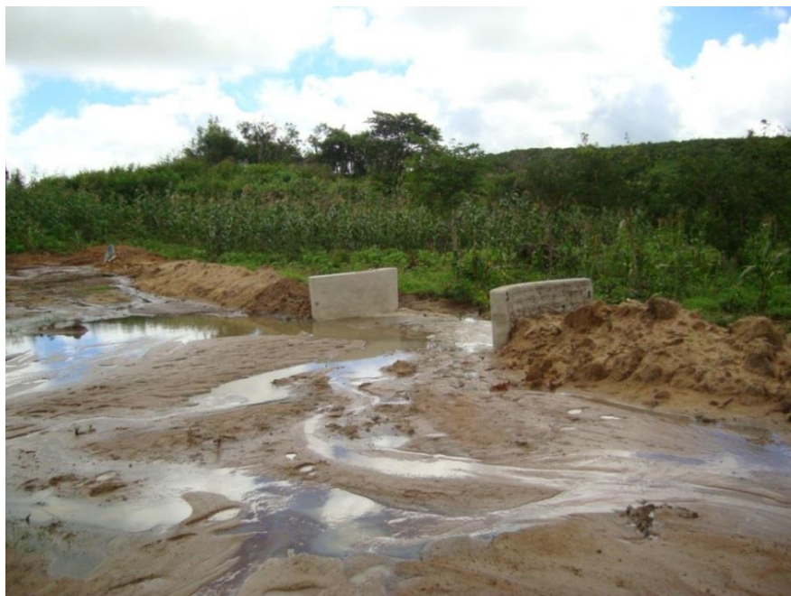
Figura 3: Barragem submersível

À montante e próximo ao barramento deve ser construído um poço amazonas ou cacimbão, revestido com anéis de concreto, tijolos, pedras ou placas.