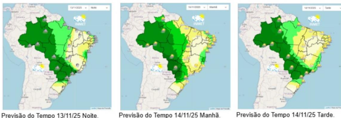
Figura 2 - Mapa de Previsão de Tempo para o Brasil por turno (Noite de 13/11/2025 a Tarde de 14/11/25).