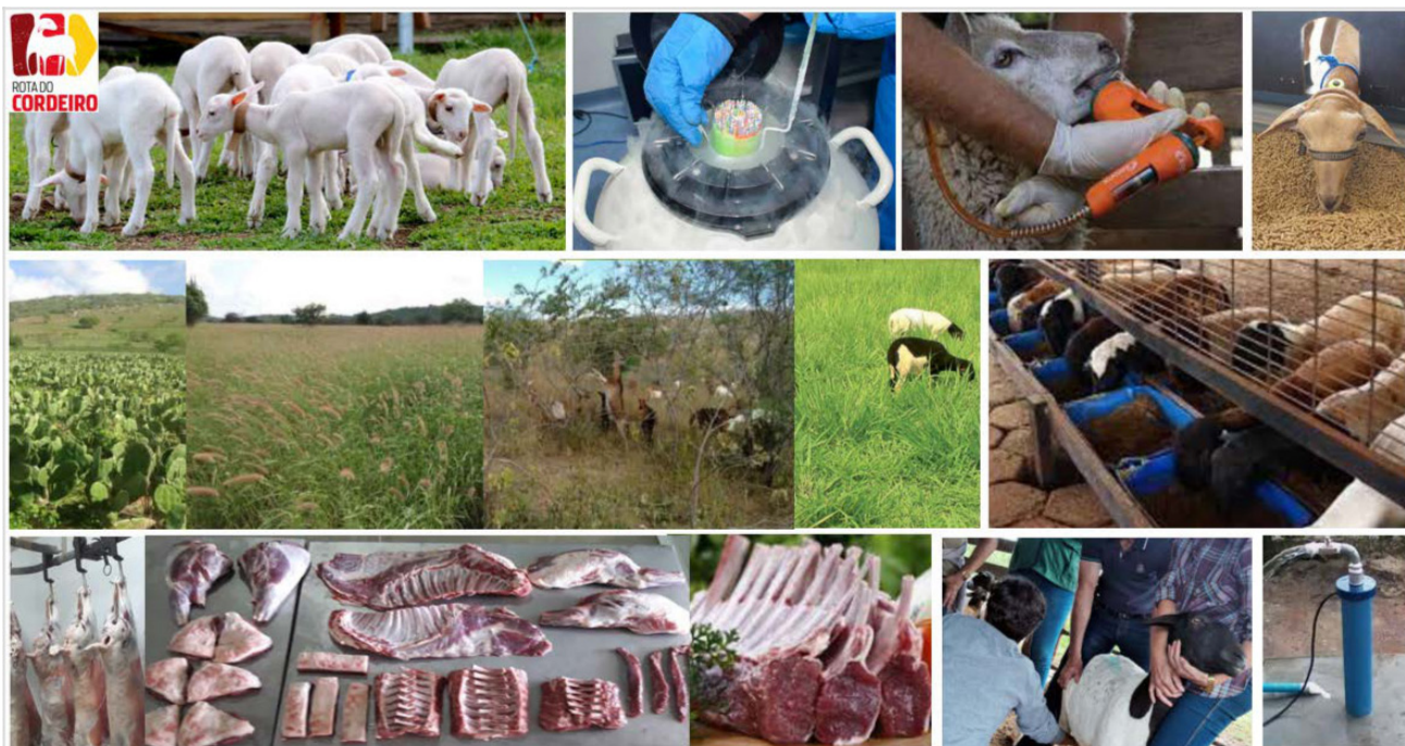
Imagem meramente ilustrativa (insumo e produção: pasto, ração, sanidade, melhoramento genético, frigorífico de pequeno porte, irrigação, máquina e equipamentos; beneficiamento e agregação de valor: certificação, novos produtos; comercialização: acesso ao mercado e criação de marca; infraestrutura: perfuração de poço artesiano; capital social: associativismo e cooperativismo, planos de negócios, capacitações; financiamento: estrutura da propriedade)