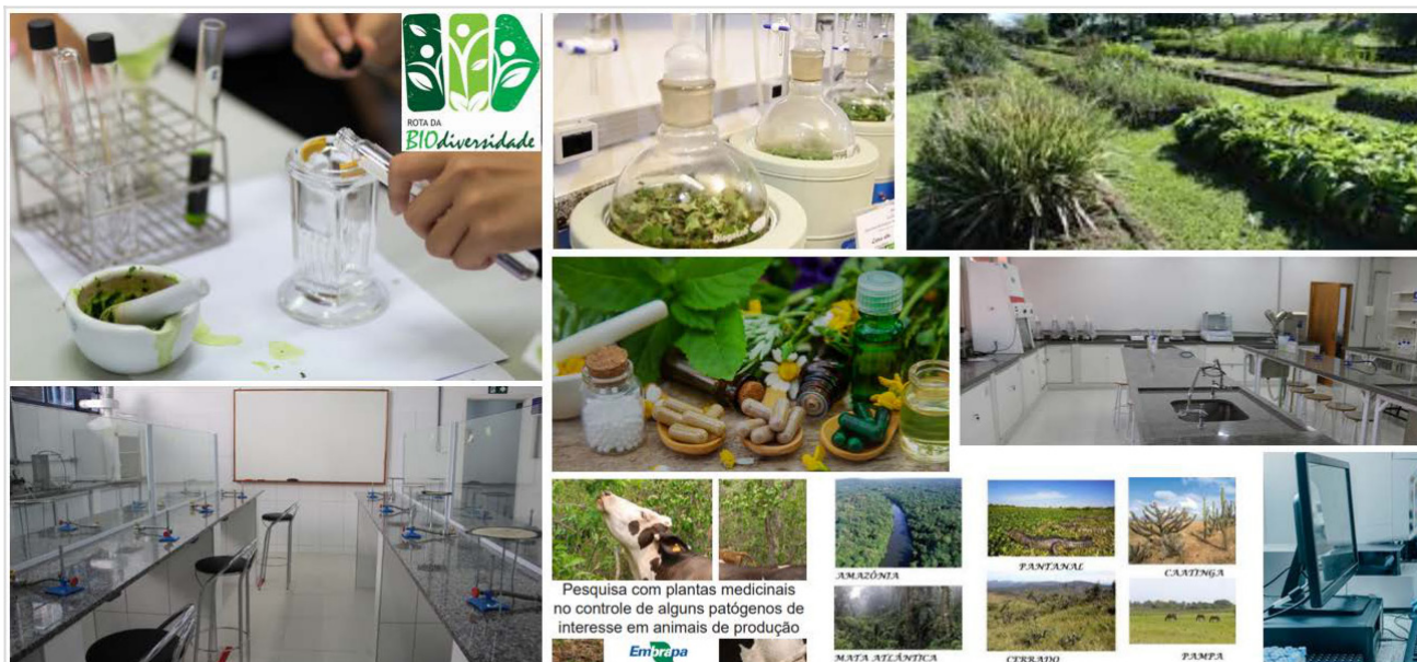
Imagem meramente ilustrativa (desenvolvimento de produtos de alto valor agregado, como biocosméticos, fitoterápicos e alimentos nutracêuticos elaborados com insumos dos biomas brasileiros; fortalecimento do tripé ensino, pesquisa e extensão; equipamentos; laboratórios; móveis e utensílios; eventos)