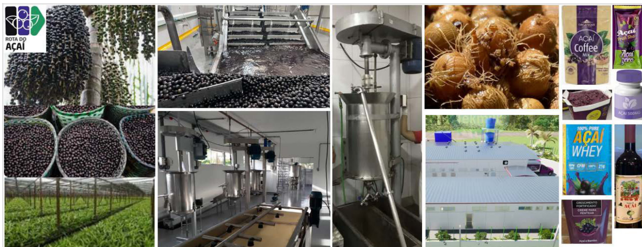
Imagem meramente ilustrativa (mudas; máquinas e equipamentos; unidade de beneficiamento; apoio ao desenvolvimento de rótulos, marcas e produtos por meio de estudos e pesquisa)