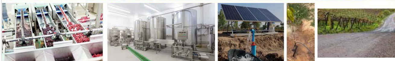
Imagem meramente ilustrativa (insumo e produção: material genético, mudas, sementes, fertilizantes, sistema de irrigação, ferramentas para plantio, manejo e colheita, certificação, capacitação na área de gestão de custos e formação de preços e no preparo de doces, geleias, compotas e manuseio de frutas; beneficiamento e agregação de valor: novos produtos, acesso ao mercado e criação de marca; infraestrutura: estradas vicinais, perfuração de poço artesiano, energia elétrica; capital social: associativismo e cooperativismo, planos de negócios; financiamento bancário e créditos especiais)