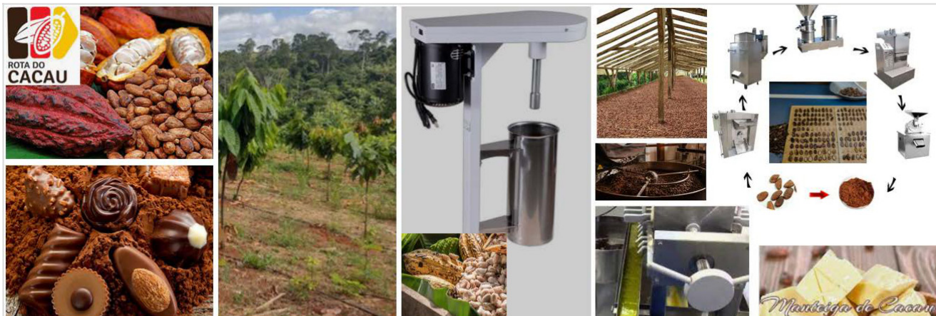
Imagem meramente ilustrativa (mudas; máquinas e equipamentos; unidade de beneficiamento; apoio ao desenvolvimento de rótulos, marcas e produtos por meio de estudos e pesquisa; certificação; eventos; )