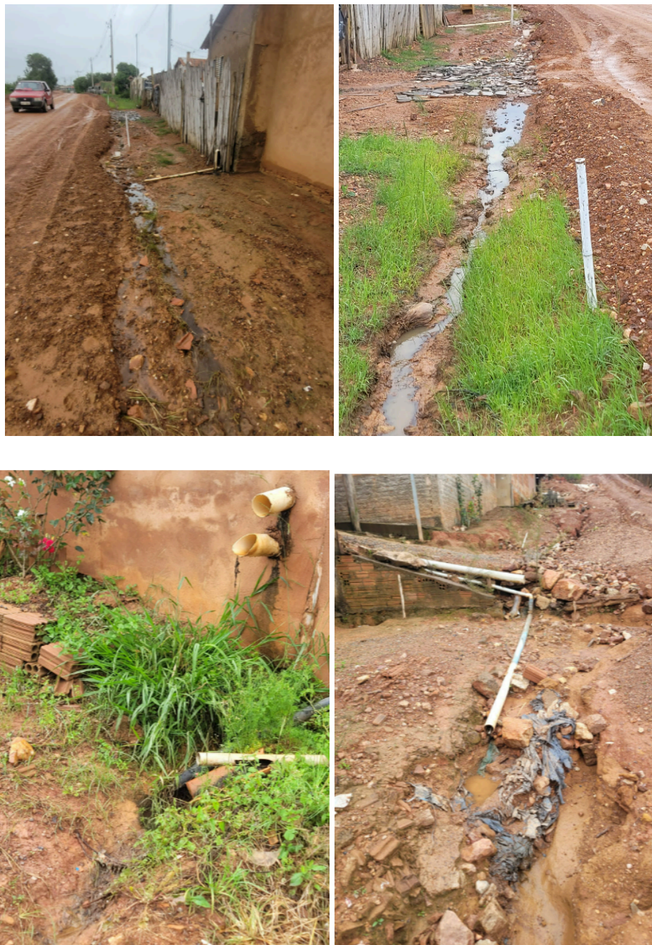
Figura 01 -Lançamento do esgoto a céu aberto Bairro Santa Quitéria.

alinhar o planejamento municipal às diretrizes nacionais de universalização dos serviços de saneamento, fortalecendo os instrumentos de gestão e assegurando a sustentabilidade econômica, operacional e ambiental do sistema de esgotamento sanitário a ser implantado no Bairro Santa Quitéria, garantindo sua adequada manutenção e funcionamento no longo prazo.