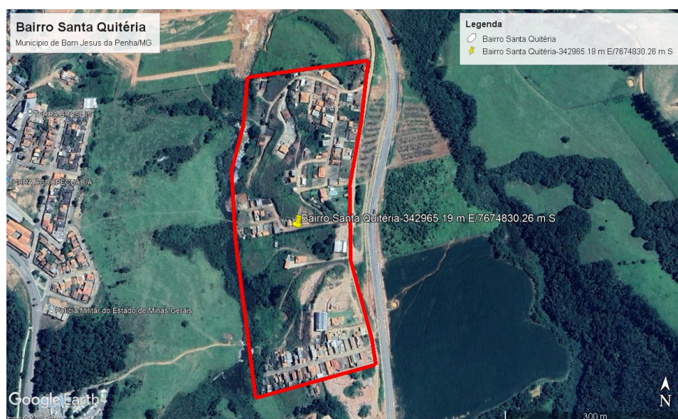
Figura 03 -Bairro Santa Quitéria.

Coordenadas Geográficas Centrais (Referência): Latitude 21° 01' 03" S e Longitude 46° 19' 13" O.