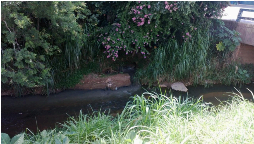
Figura 1-Ponto principal de lançamento de efluente no Ribeirão Santo Antônio.

Situação Geográfica do Local: As intervenções serão realizadas no perímetro urbano do município de Jacutinga/MG. As Estações de Tratamento de Esgoto (ETE) serão implantadas em locais estratégicos para interceptar a rede coletora existente, que atualmente lança os efluentes in natura no Ribeirão Santo Antônio .