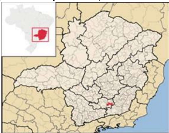
Figura 1 – Localização do Município de Barbacena em MG

A Bacia Hidrográfica do Rio Grande (Figura 2) fica localizada na região Sudeste do Brasil, abrangendo parte dos estados de Minas Gerais e São Paulo, sendo 60,20% no primeiro e 39,80% no segundo, com uma área de drenagem total de 143.437,79 km 2 . Seus principais afluentes são os rios: Sapucaí, Pardo, Turvo, Verde, Capivari, Sapucaí-Mirim, Mogi-Guaçu, Mortes, Jacaré, Santana, Pouso Alegre, Uberaba e Verde ou Feio (ARPA RIO GRANDE, 2020).