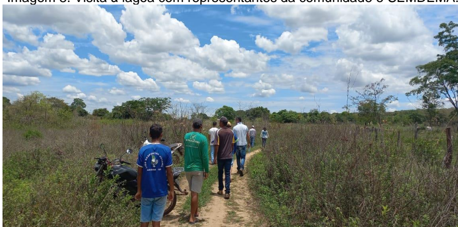
Imagem 8. Visita à lagoa com representantes da comunidade e SEMDEMA.