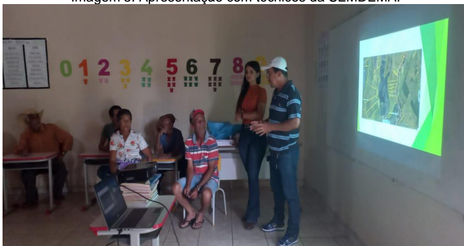
Imagem 5. Apresentação com técnicos da SEMDEMA.

Ocorreu também uma apresentação efetuada por técnicos da Secretaria de Desenvolvimento Econômico e Meio Ambiente – SEMDEMA onde foi possível ouvir e debater com as representantes locais sobre os principais problemas ambientais da comunidade, conforme imagens abaixo: