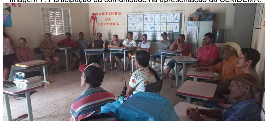
Imagem 7. Participação da comunidade na apresentação da SEMDEMA.