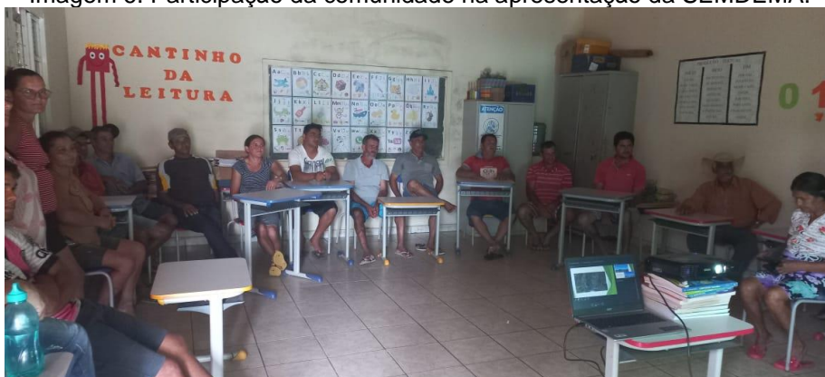
Imagem 6. Participação da comunidade na apresentação da SEMDEMA.