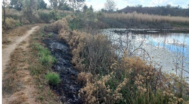
Imagem 4. Localização da lagoa de Lagoa do Bolor.

Conforme imagem abaixo (imagem 4) em visita técnica ao local foi encontrado vestígios de queimada na mata ciliar que ainda existe.