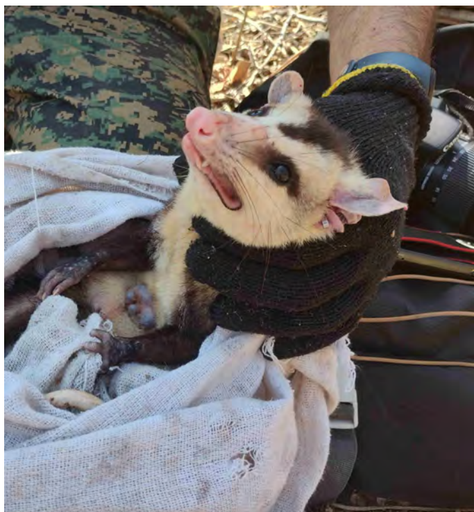
Monitoramento da mastofauna em Cachoeira dos Índios/PB

MIDR(Empreendedor) CMT Ambiental(Acompanhamento) CEMAFAUNA/UNIVASF(Execução)