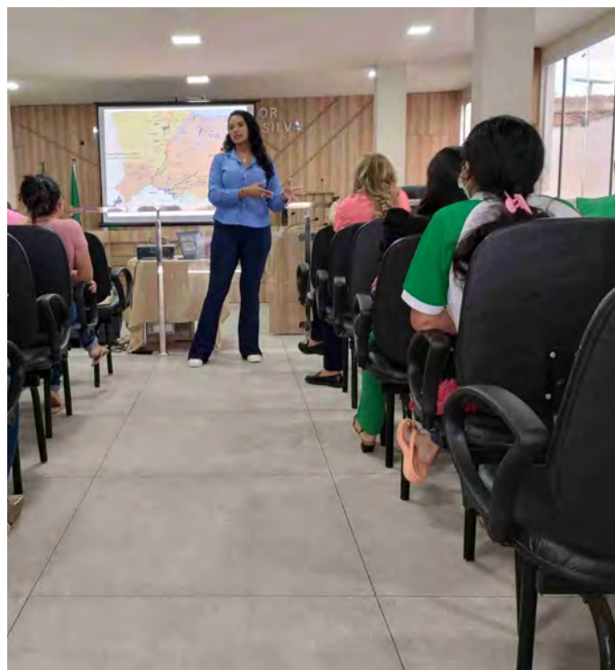
Execução do Módulo 1 de capacitação dos agentes municipais de saúde no município de José da Penha/RN