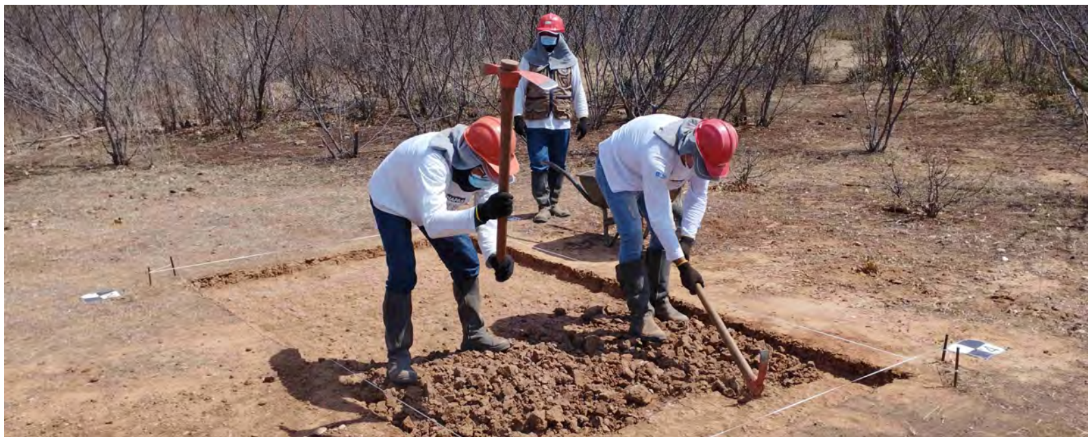
Atividade de resgate do sítio arqueológico Canto do Caburé (Segmento de Canal 13 - WBS 4239, município de Uiraúna/RN)

O Programa de Prospecção, Identificação, Monitoramento e Salvamento de Bens Arqueológicos e de Educação Patrimonial tem como objetivo identificar, documentar, salvaguardar, pesquisar e divulgar o Patrimônio Arqueológico evidenciado na área de abrangência do Ramal do Apodi. As atividades previstas neste Programa são realizadas pelas equipes de pesquisadores do Instituto Nacional de Arqueologia, Paleontologia e Ambiente do Semiárido do Nordeste do Brasil (INAPAS), vinculado à Fundação Museu do Homem Americano (FUMDHAM).