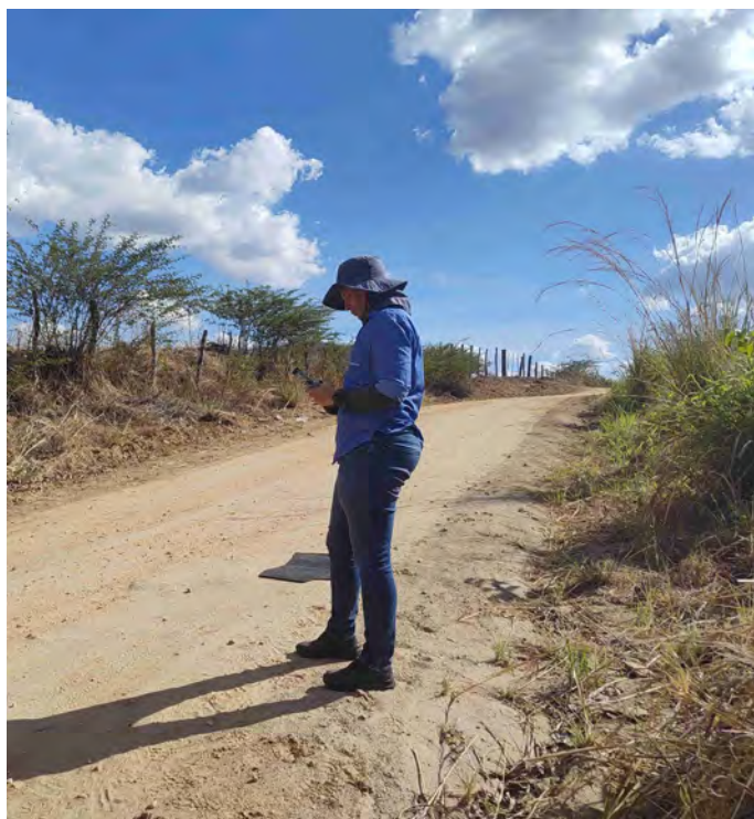
Identificação de área por meio de Drone

MIDR(Execução) CMT Ambiental (Acompanhamento)