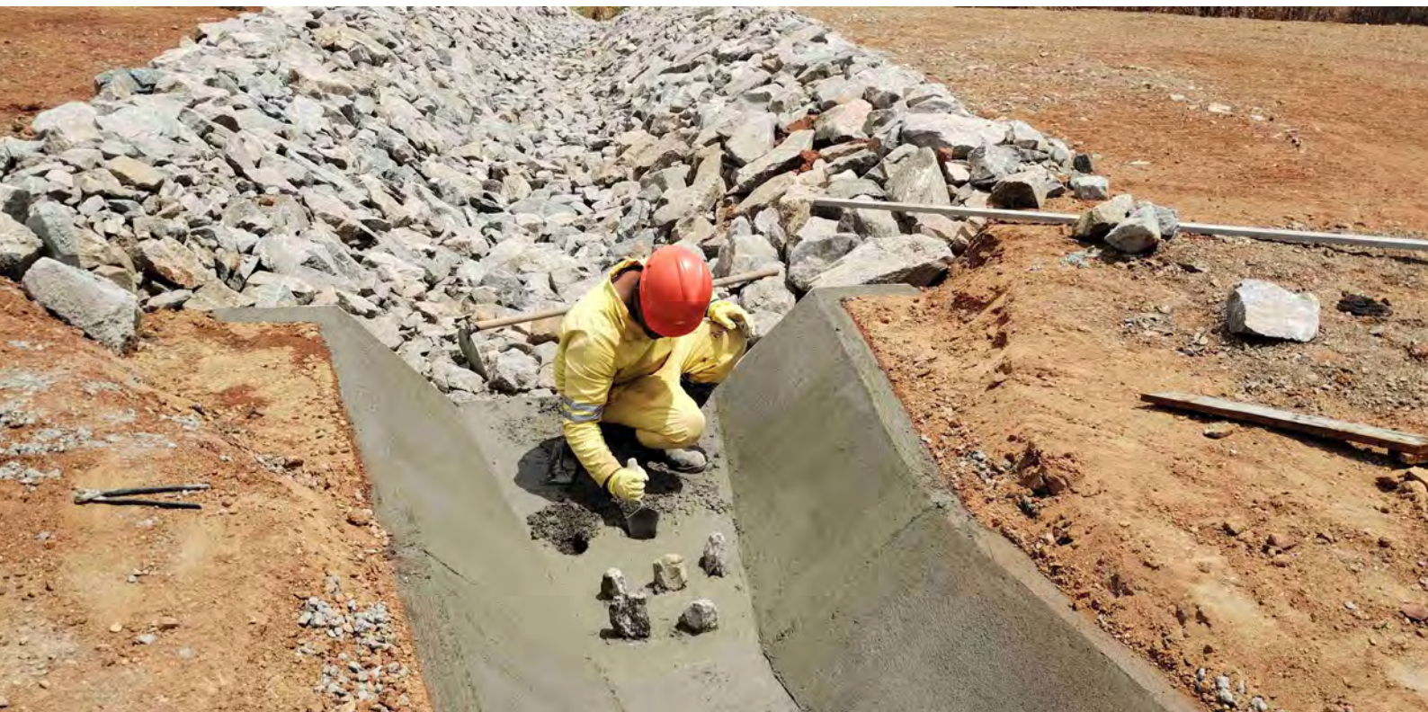
Instalação de sistema de drenagem no Canal 2

O Programa de Monitoramento dos Processos Erosivos (PBA 17) tem como objetivo indicar medidas de controle de estabilização do solo, a serem aplicadas durante a construção do Ramal do Apodi, para evitar a ocorrência de processos erosivos, bem como definir dispositivos e critérios para monitoramento dos pontos críticos, garantindo a manutenção das condições adequadas de estabilização dos solos.