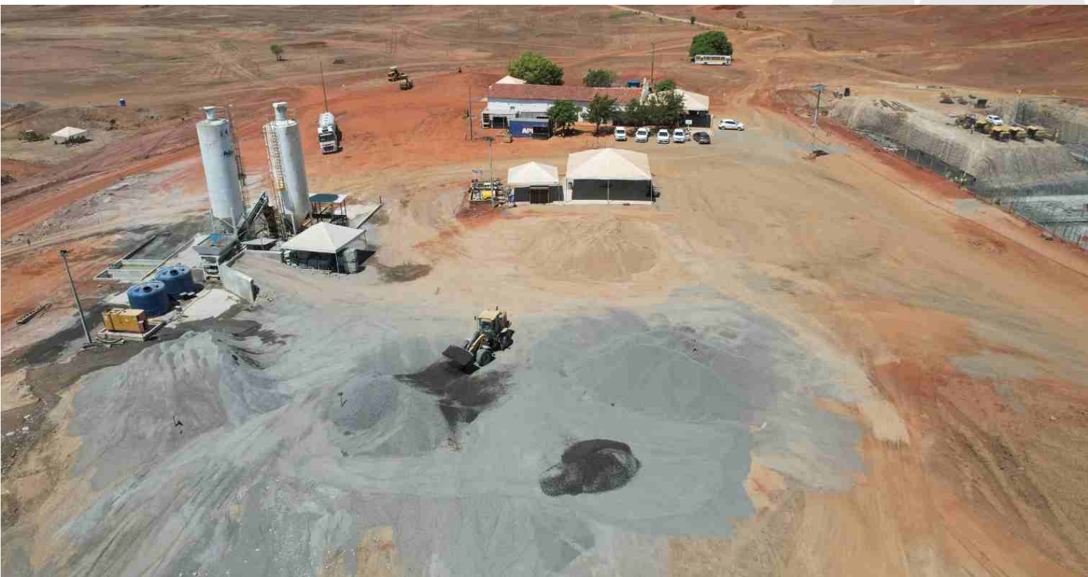
Atividades construtivas na área do Reservatório Tambor, município de Cachoeira dos Índios.