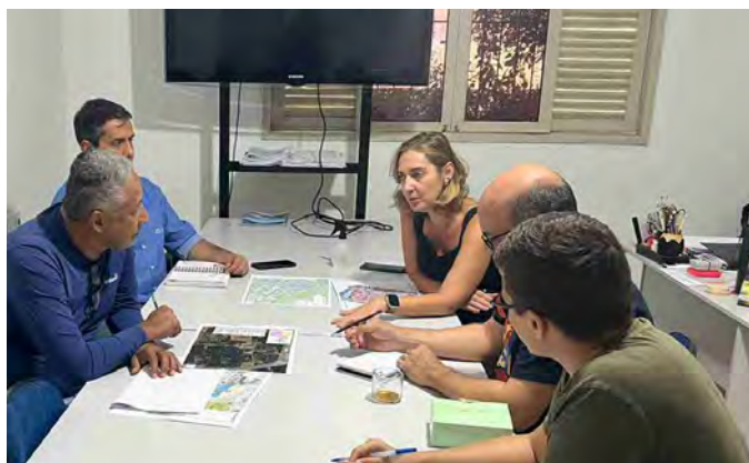
Reunião com a equipe técnica responsável pela execução do Programa de Reassentamento das Populações.