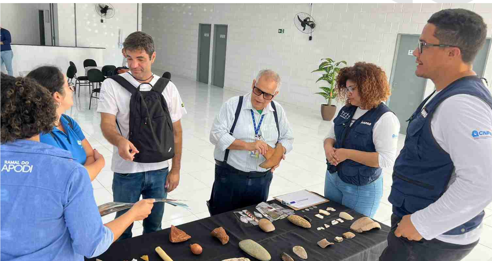
Educação Patrimonial com a presença da Agência Nacional de Águas (ANA)