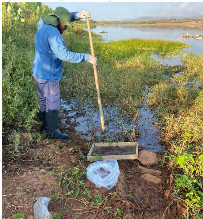
Coleta de zoobento de margem no ponto de monitoramento 07, José da Penha/RN