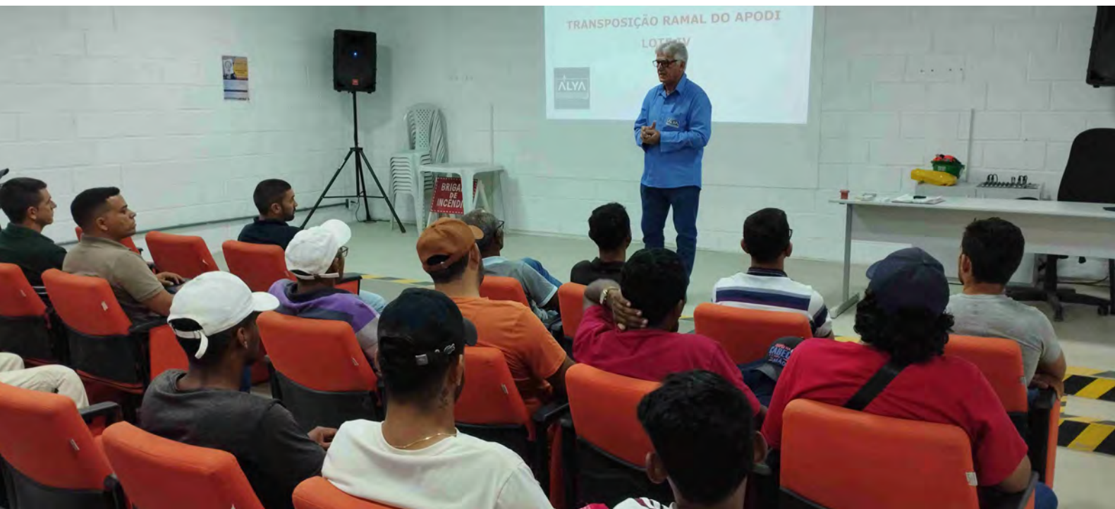
Treinamento admissional para novos colaboradores no Canteiro Central de Obras, município de Ipaumirim/CE.

O Programa de Treinamento e Capacitação dos Técnicos da Obra em Questões Socioambientais, Saúde e Segurança (PBA 05) têm como objetivo geral capacitar técnicos e trabalhadores das obras, durante a implantação do Ramal do Apodi, por meio de educação ambiental com práticas sustentáveis, bem como, para a adoção de medidas preventivas voltadas à saúde e segurança.