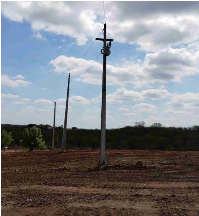
Rede elétrica interceptada pelas obras do Ramal do Apodi. Cachoeira dos Índios/PB

MIDR (Empreendedor) CMT Ambiental (Acompanhamento) Álya Construtora (Execução)