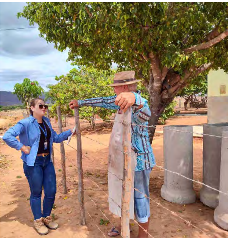
Mobilização dos comunitários no município de Jose da Penha/RN

O Programa de Comunicação Social, em função do seu objetivo principal - constituição de um canal de comunicação entre o poder público e a sociedade e pelo seu caráter de suporte ao empreendimento, articula-se com o conjunto de ações e atividades relacionadas às obras e aos Programas Ambientais. A interface deste programa com os demais programas ambientais visa subsidiar a sistematização de informações para fins de divulgação.