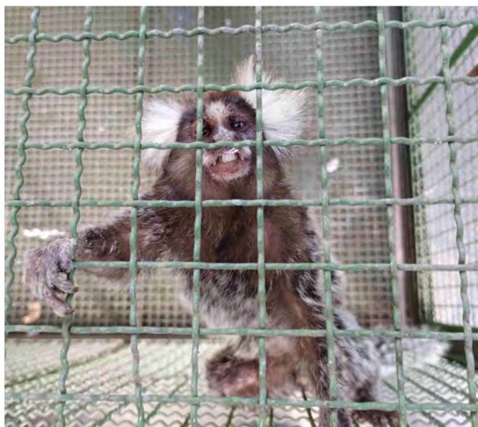
Indivíduo adulto de Callithrix jacchus resgatado pela equipe do CEMAFAUNA/UNIVASF durante a supressão vegetal, para avaliação do quadro clínico.

MIDR (Empreendedor) CMT Ambiental (Acompanhamento) Álya Construtora (Execução) UNIVASF (Acompanhamento)