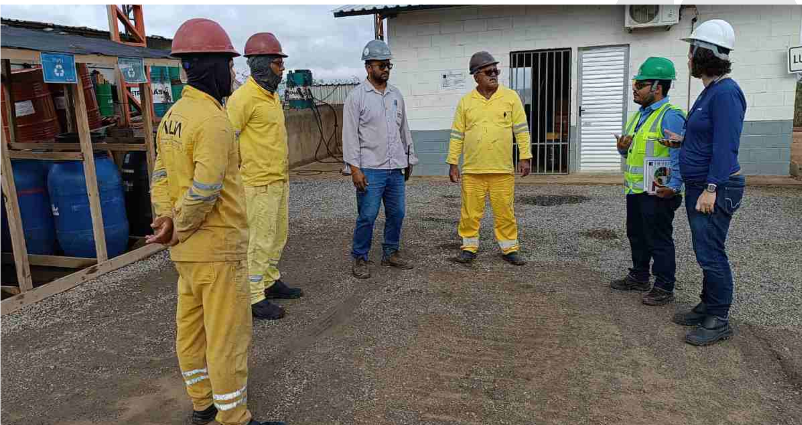
Treinamento com o tema Utilização do Kit de emergência ambiental