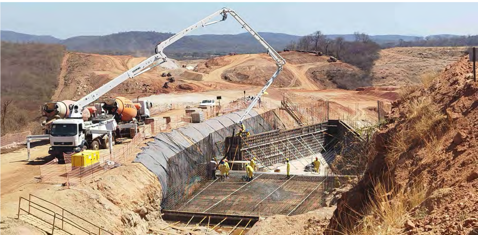
Atividade de lançamento de concreto na estrutura do Rápido Arruído (WBS 4372), município de Cajazeiras - PB.

E ste programa tem por objetivo dotar o Ramal do Apodi de mecanismos gerenciais eficientes que garantam a execução de todas as ações planejadas para controlar, minimizar, monitorar e compensar os impactos gerados, de forma a manter um elevado padrão de qualidade ambiental na construção e operação do empreendimento.