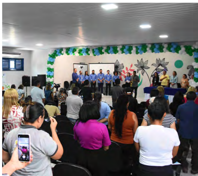
Segunda audiência pública realizada no município de Ipaumirim/CE

MIDR (Empreendedor) CMT Ambiental (Execução)