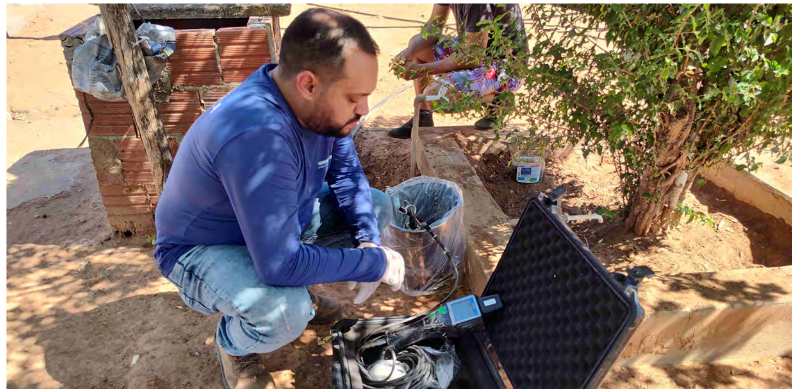
Execução de análise físico-química no ponto de monitoramento de água subterrânea

O Programa de Monitoramento de Fontes Hídricas Subterrâneas tem por objetivo realizar o diagnóstico e o monitoramento qualitativo das fontes hídricas subterrâneas situadas em áreas potencialmente vulneráveis a alterações na dinâmica do aquífero (entorno dos reservatórios/açudes e canais naturais) decorrentes da implantação do Ramal do Apodi, antes e após o início de operação do empreendimento.