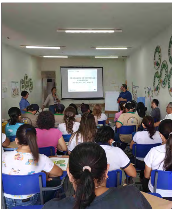
Atividade do programa de educação ambiental com os profissionais municipais de saúde da cidade de Umari/CE.