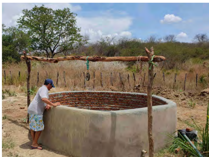
Identificação de sistema de abastecimento da Comunidade Catingueira Cachoeira dos Índios/PB.

MIDR (Empreendedor) CMT Ambiental (Acompanhamento)