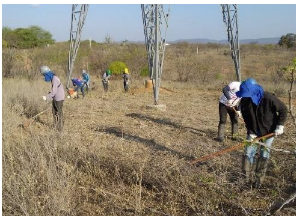
Remoção da cobertura vegetal em regeneração na faixa de servidão da linha de transmissão do Eixo Norte.

Operadoras das LTs do PISF (Execução) Consórcio Gestor Ambiental (Execução e Acompanhamento)