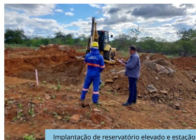
Implantação de reservatório elevado e estação de bombeamento do Sistema de Irrigação da VPR Baixio dos Grandes, Cabrobó - PE.