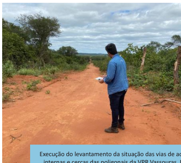
Execução do levantamento da situação das vias de acesso internas e cercas das poligonais da VPR Vassouras, Brejo Santo-CE, Trecho II, Eixo Norte.