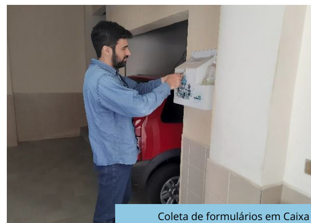
Coleta de formulários em Caixa de Comunicação instalada no Sindicato dos Trabalhadores Rurais de Monteiro - PB.