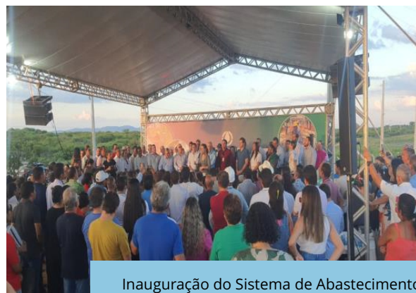
Inauguração do Sistema de Abastecimento de Água do Distrito Rio da Barra (Sertânia – PE).