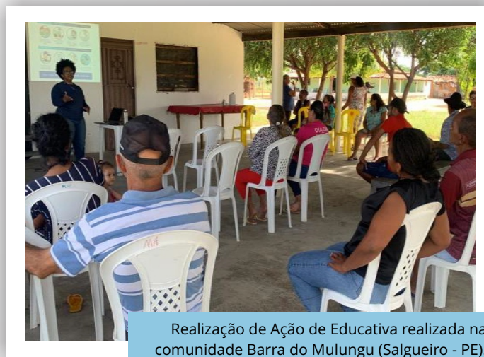
Realização de Ação de Educativa realizada na comunidade Barra do Mulungu (Salgueiro - PE).