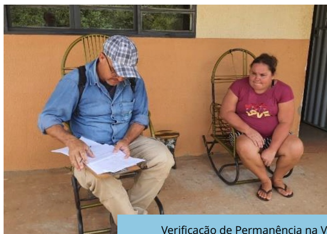
Verificação de Permanência na VPR Bartolomeu, Cajazeiras - PB.