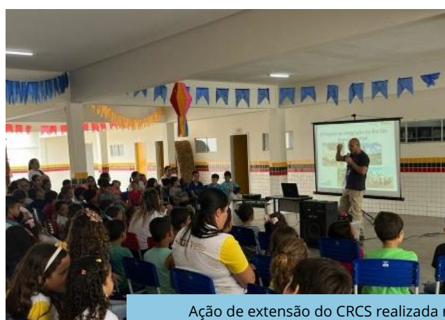
Ação de extensão do CRCS realizada na Escola Municipal Manoel Leandro de Moraes (Custódia - PE), Trecho V, Eixo Leste do PISF.