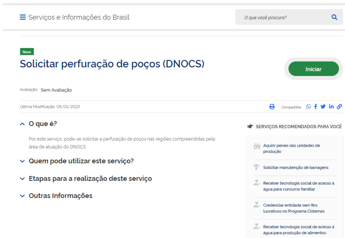
Figura 2. Modelo do DNOCS a ser utilizado.