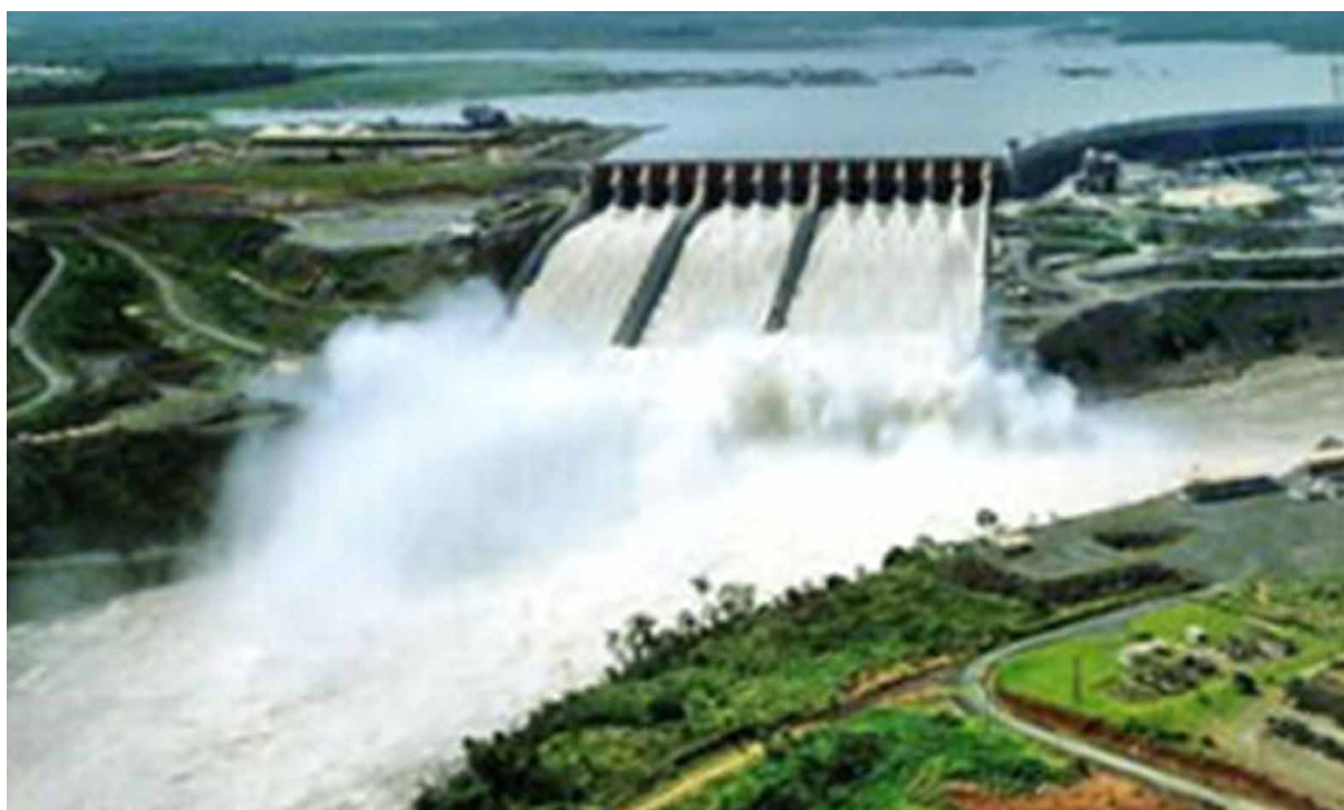
Barragem de Itaipu (Brasil - Paraguai)

- Apresentação sobre a adoção das práticas de Avaliação de Impacto Regulatório, nos normativos editados pelo CNRH, em atendimento ao Decreto 10.411, de 30 de junho de 2020.