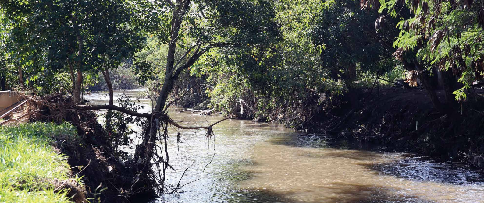
Riacho Fundo - DF (Área de Preservação Ambiental)