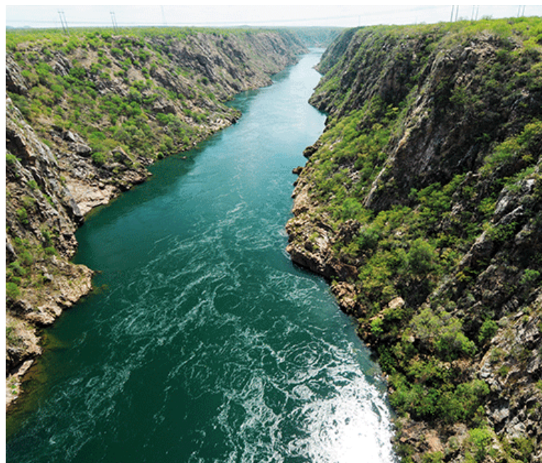
Vista aérea do Rio São Francisco

- E, por fim, explicações e socialização sobre o processo de Elaboração do PNRH 2022-2040,