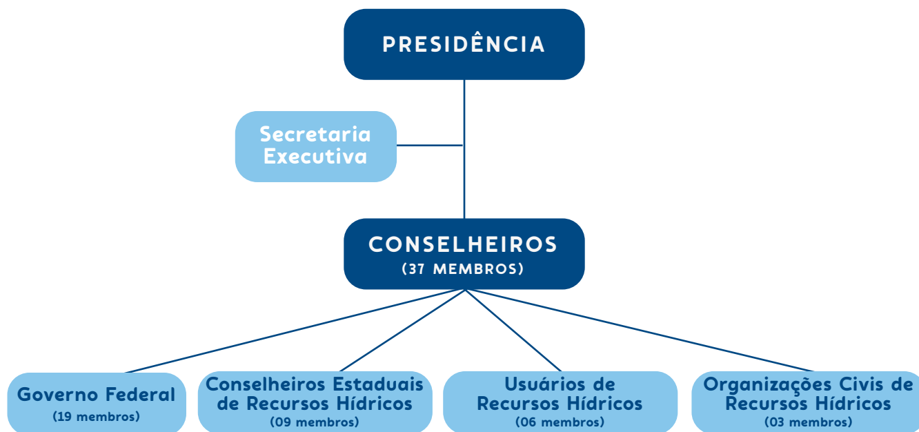
Figura 1 - Estrutura de funcionamento do CNRH

Outras competências do CNRH são i) analisar propostas de alteração da legislação pertinente a recursos hídricos; ii) estabelecer diretrizes complementares para implementação da Política Nacional de Recursos Hídricos; iii) promover a articulação do planejamento de recursos hídricos com os planejamentos nacional, regionais, estaduais e dos setores usuários; iv) arbitrar conflitos sobre recursos hídricos; v) deliberar sobre os projetos de aproveitamento de recursos hídricos cujas repercussões extrapolem o âmbito dos estados em que serão implantados; vi) aprovar propostas de instituição de comitês de bacia hidrográfica; vii) estabelecer critérios gerais para a outorga de direito de uso de recursos hídricos e para a cobrança por seu uso; e viii) aprovar o Plano Nacional de Recursos Hídricos e acompanhar sua execução. O Conselho se manifesta por meio de resolução, moção e comunicação.