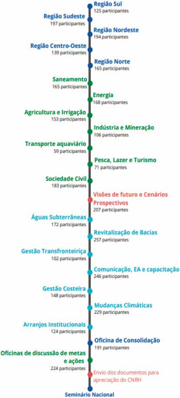
Figura 2 - Fonte: Plano de Ação: Estratégia Nacional para o Gerenciamento dos Recursos Hídricos 2022-2040

Diagnóstico e Prognóstico dos Recursos Hídricos no Brasil e à construção do Plano de Ação e do Anexo Normativo; ii) consolidar os resultados do processo de elaboração do PNRH 2022-2040; e iii) propiciar o acompanhamento, contribuições e validação das etapas de elaboração do PNRH 2022-2040 pelo CNRH e suas Câmaras Técnicas. O infográfico abaixo detalha a quantidade de eventos por setores/temáticas e participantes nos eventos realizados no decorrer do processo: