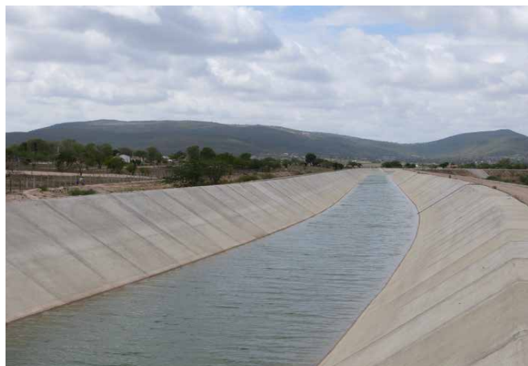
Transposição do Rio São Francisco

A atual composição conta com representantes: i) do Ministério do Desenvolvimento Regional; ii) da Justiça e Segurança Pública, iii) da Defesa, iv) das Relações Exteriores, v) da Economia, vi) da Infraestrutura, vii) da Agricultura, Pecuária e Abastecimento, viii) da Educação, ix) da Cidadania, x) da Saúde, xi) de Minas e Energia, xii) da Ciência, Tecnologia e Inovações, xiii) do Meio Ambiente, xiv) do Turismo, xv) da Mulher, da Família e dos Direitos Humanos, além de integrantes dos conselhos estaduais e distrital de recursos hídricos e os setores usuários de recursos hídricos.