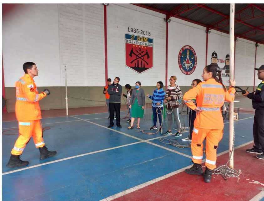
Figura 06. Treinamento com Corpo de Bombeiros em 17 de junho de 2023.

Durante o processo de formação, os membros dos NUPDECS passam por um treinamento com o corpo de bombeiros com instruções sobre técnicas de autossalvamento e salvamento e primeiros socorros ( FIGURA 06 ).