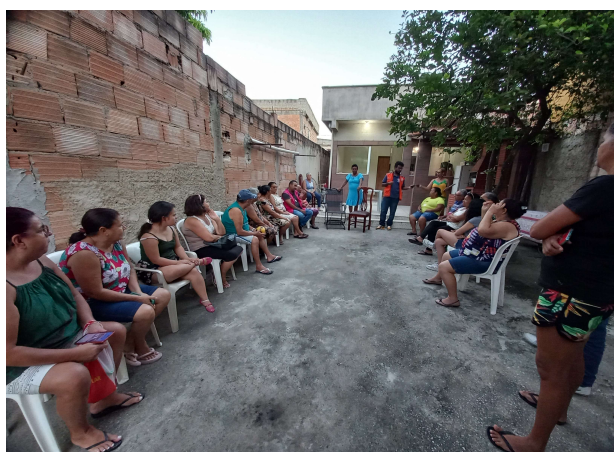
Figura 01. Abertura do NUPDEC Vila Beija-Flor, 28/02/2023

Em uma primeira reunião, a equipe de mobilização apresenta às pessoas a Defesa Civil, seu lugar na estrutura do poder público, suas funções e objetivos. Em seguida, os participantes são ouvidos para que se conheça mais sobre a realidade em que vivem, sobre os riscos e problemas e potencialidades com as quais convivem. Após essas atividades iniciais, os participantes da reunião são convidados a integrarem o NUPDEC e participarem de um grupo de WhatsApp por meio do qual se constituirá uma via de contato em mão dupla entre participantes do Núcleo e a Defesa Civil ( Figuras 01 e 02 ).