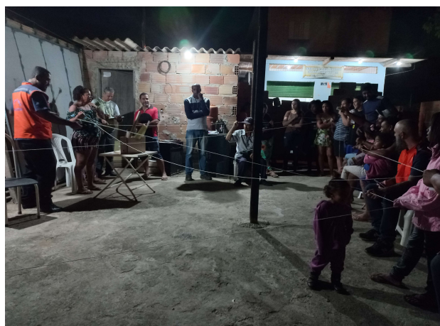
Figura 02. Abertura do NUPDEC Nelson Mandela, 04/04/2023/02/2023.