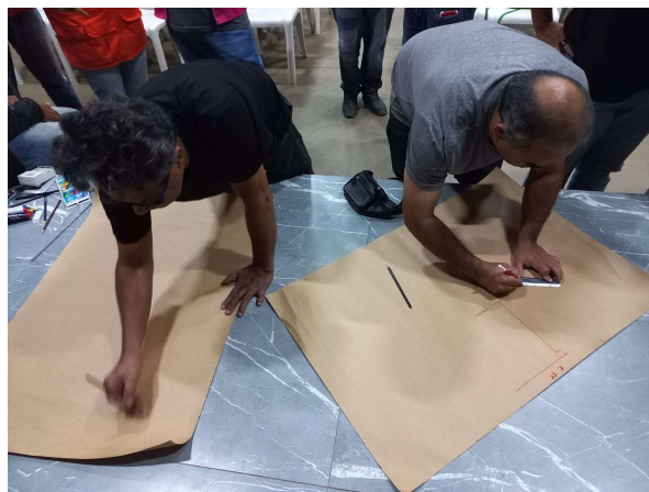
Figura 03. Confeccção do Mapa no NUPDEC Jardim Califórnia, 23/05/2023. FONTE: Defesa Civil de Contagem.

A utilização de estratégias da metodologia de Diagnóstico Rápido Participativo (DRP), entre elas a construção do Mapa de Mancha Falada em que a comunidade indica as áreas de risco, o histórico de alagamentos ou deslizamentos de terra e as rotas de fuga em caso de desastre traz grande aprendizado à equipe da Defesa Civil e à própria comunidade. O mapa também é útil para a compreensão da realidade “antes e depois” vivenciada pela comunidade e assim permite verificar a possível perda de área arborizada e vegetada, o processo de adensamento populacional, a impermeabilização de vias públicas e áreas particulares ( Figuras 03 E 04 ).